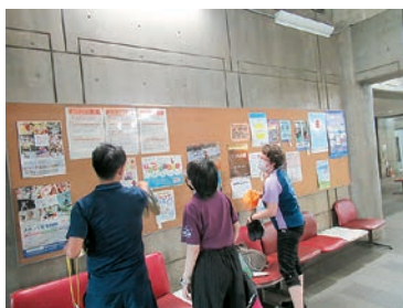
3-⑥ There are lots of info on sports clubs on the notice board. 掲示板上にはたくさんのサークル情報があります