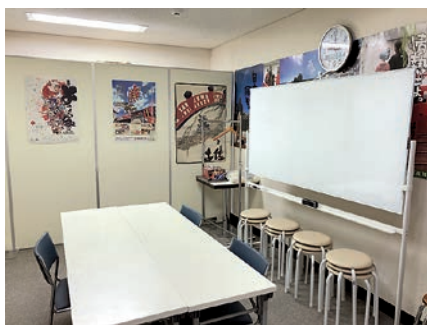
1-② You can borrow the Community Room for free (0 yen) コミュニティールームは無料(=0円)で借られます。