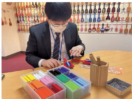
1-④ Making naruko 鳴子づくり体験

You can follow along with a video to learn how to perform the basic Yosakoi dance, Seicho Yosakoi Naruko Odori. It's free (0 yen), and the video has English subtitles. The museum will also let you borrow outfits and naruko to dance with. In addition, you can try making your own naruko . You can choose either painted wood ones for ¥1,500, or plain wood ones for ¥1,000 (both come in sets of two). By choosing from a variety of colors, you can assemble your own personal naruko . I decided to make blue naruko to symbolize the blue sky and sea of Kochi. You should come make your own naruko too!