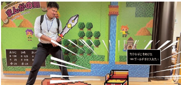
2-② At the AR (Augmented Reality) exhibit on the first floor, you can download an app to your phone and take photos that make it look like you've entered the world of manga 館内の1階には、AR(拡張現実)の展示があり、携帯でアプリをダウンロードすると、漫画の世界に入ったような写真が撮れます。