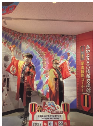
1-③ I tried dancing the Yosakoi Naruko Odori