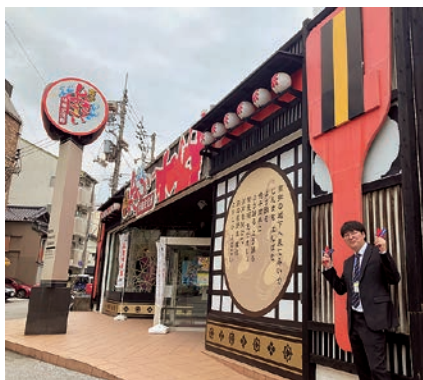
1-① Kochi Yosakoi Information Exchange Centre Museum 高知よさこい情報交流館

The Yosakoi Festival was created in Kochi in 1954. At the time, life was difficult for the people of Kochi Prefecture, as they were still suffering from the aftereffects of both the war and the Nankai Earthquake. Taking inspiration from the powerful rhythm of the Awa Odori (a famous dance festival in Tokushima Prefecture), the Yosakoi Festival was started as a form of entertainment to cheer up everyone in Kochi. It was decided that the festival would be held on August 10 th and 11 th , the period of summer with the least rainfall. Opening and closing celebrations also occur on August 9 th and 12 th . The Yosakoi Festival has three basic rules: 1) The song you dance to must contain the phrase “Yosakoi Naruko Odori,” 2) Dancers must hold naruko in their hands and move forward, and 3) Teams must prepare a jigatasha , a truck that carries a speaker (each team's truck is decorated differently). In 1972, the Yosakoi Odori was first danced overseas in France. Then in 1992, the Yosakoi Soran Festival was started in Hokkaido, and from there the dance spread across Japan and the world, becoming even more well known. There are now Yosakoi teams in 33 different countries and regions in the world.