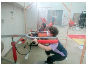
3-④ Doing squats! スクワット!