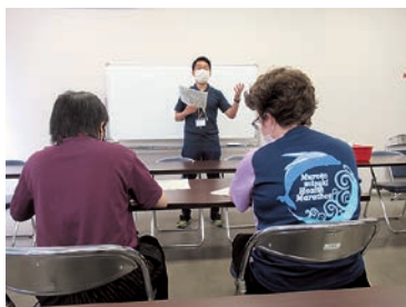
3-② Studying training theory トレーニングの理論を勉強中