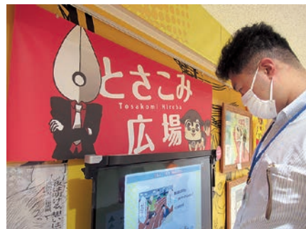
2-③ The author looking through past teams that won awards in the Manga Koshien 過去のまんが甲子園の受賞チームを検索中(筆者)

たくさんの漫画を読めるだけでなく、実際に作画を無料で体験できる施設があると伺い、私とKIAスタッフは高知市内にある「高知まんがBASE」(以下、「まんがBASE」)を訪れました。