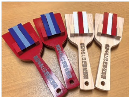
1-⑤ Left: Painted wood (set of two) for ¥1,500; Right: Plain wood (set of two) for ¥1,000 左: カラー(2本1組)1,500円、 右: 白木(2本1組)1,000円

○Kochi Yosakoi Information Exchange Centre Museum 〒780-0822 1-10-1 Harimaya-cho, Kochi City Phone: 088-880-4351 FAX: 088-880-4352 E-mail: honkeyosakoi@gmail.com