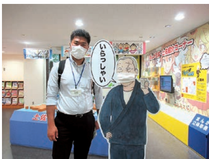
2-① Manga welcomes you at the first floor entrance 1階の入り口から漫画でお出迎え

After hearing about Kochi Manga BASE (“Manga BASE”) in Kochi City, a KIA staff member and I decided to pay it a visit.