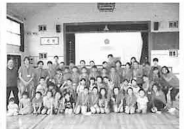
平尾子ども太鼓の皆さんと