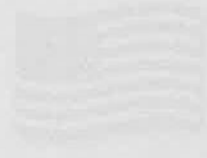
【全米国旗デザイン】

Faded text in the bottom section, likely the end of a participant's report.