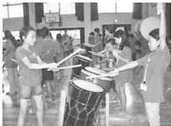
一生懸命、練習をしました