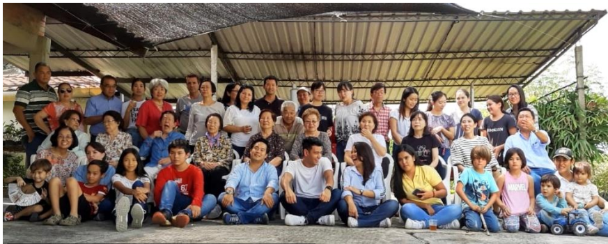
農園で県人会の皆さんと昼食