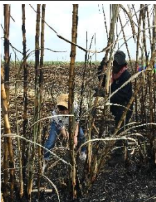
サトウキビ栽培地見学