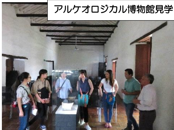
アルケオロジカル博物館見学