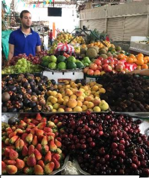
アルメラ市場訪問