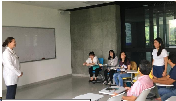
ハベリアナ大学訪問