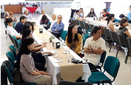
天皇の誕生日祝い式典 （日系人協会主催）