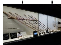
梓御弓 (あずさのおんゆみ)