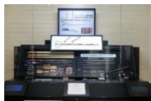
玉纏御太刀 (たままきのおんたち)