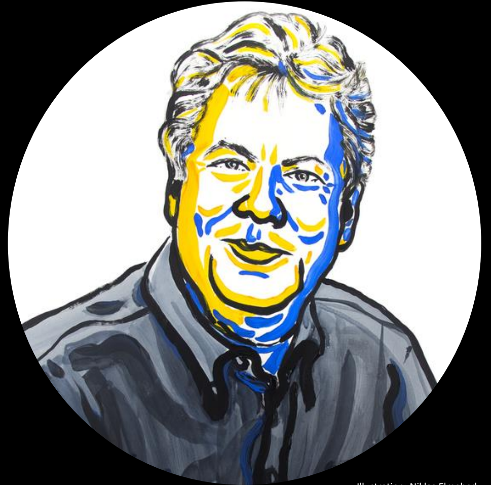
Illustration: Niklas Elmehed Copyright: Nobel Media AB 2017