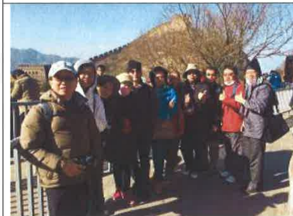
登萬里長城發思古幽情