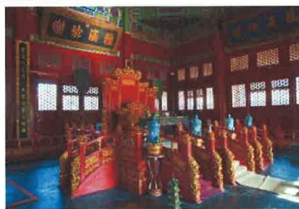
「辟雍」-古代皇帝講課地點