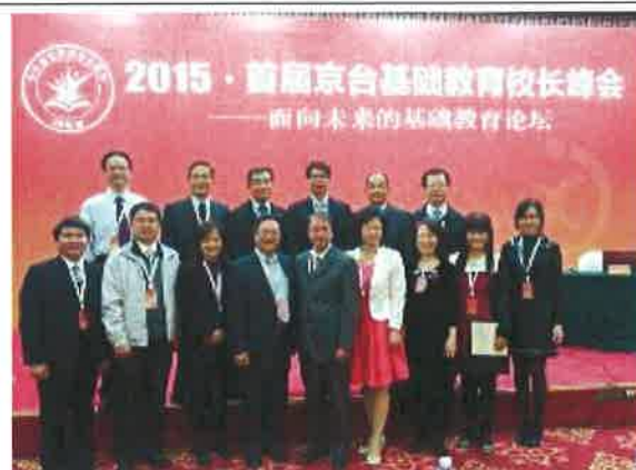
臺中團校長與大陸代表合影