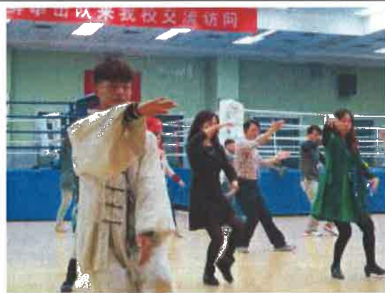
什剎海體校的太極拳教學體驗