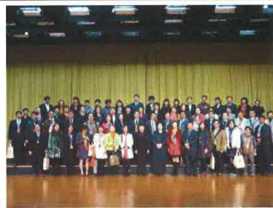
分論壇後參與代表合影--