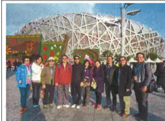
參觀鳥巢（北京國家體育場）