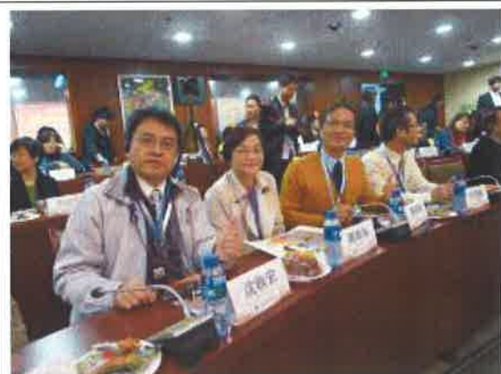
參加北京第二實驗小學分論壇