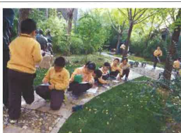
北京第二實驗小學—觀察植物生長 教學一景