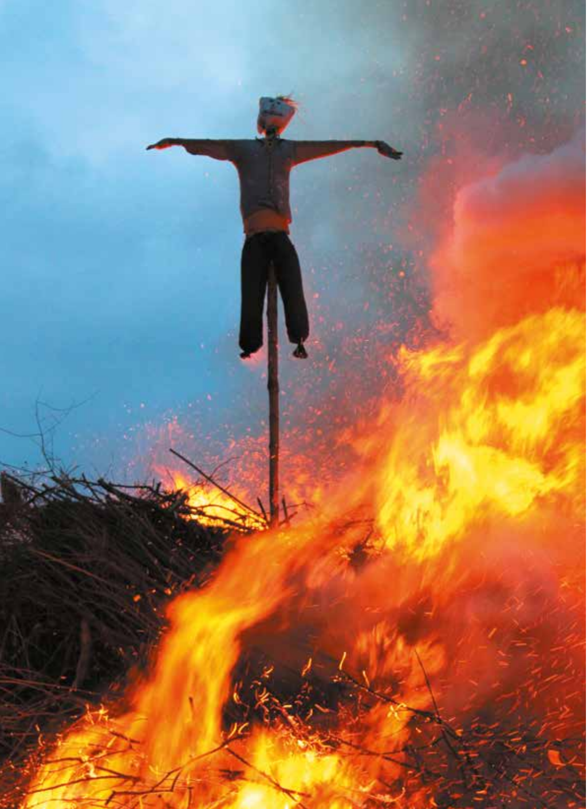
▲ Judasfeuer in Grafrath, 2017