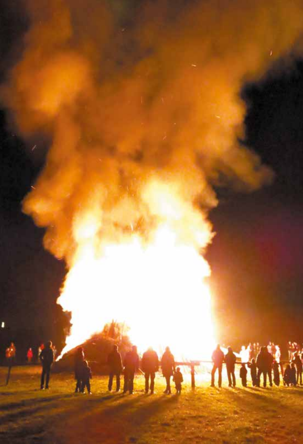
▲ Judasfeuer in Stätzlich, 2013