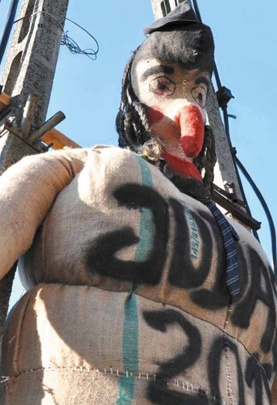
▲ Stereotyp antisemitisch dargestellte Judasfigur in Pruchnik, Polen, 2019