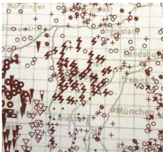
▲ ▲ Judasfeuer in Oberbayern, 1933 © Harmjanz/Röhr, Atlas, Karte 25e