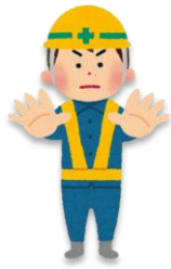
た い きんし 立ち入り禁止