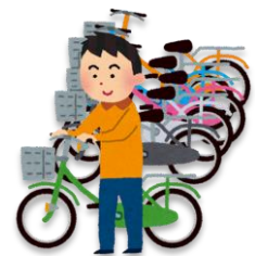
ちゅうりん 駐輪(する)