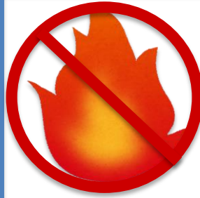
か き げん きん 火 気 厳 禁