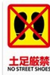
どそくげんきん 土足厳禁