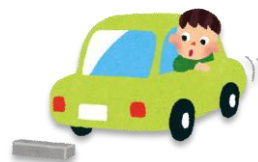
ちゅうしゃ 駐車(する)