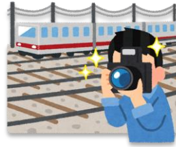
しゃしん と 写真を撮る