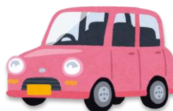
くるま じどうしゃ 車(自動車)