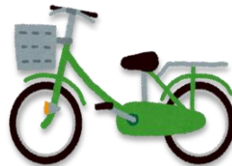
じてんしゃ 自転車