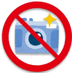
さつえいきんし フラッシュ撮影禁止