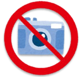
さつえいきんし 撮影禁止