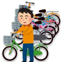
じてんしゃ と (自転車)を止める