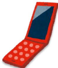
けいたいでんわ 携帯電話