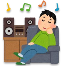
おんがく き 音楽(を聴く)