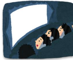
えい が み 映画(を見る)