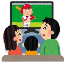
やきゅう み (野球を)見る