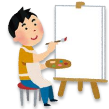
え か 絵を描く