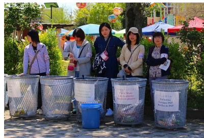
ゴミ分別のお手伝い