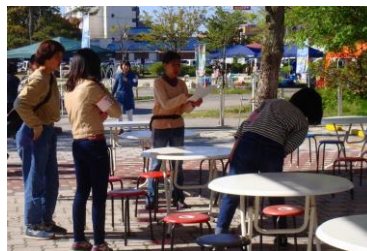
椅子やテーブルの設置