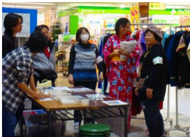
コーナーごとに役割を分担