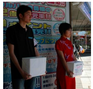
民族衣装を着て募金活動