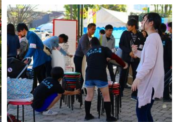
後片付け・撤収作業