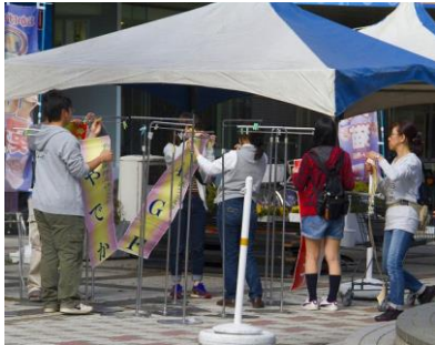
のぼり旗や掲示物の取付け・設置