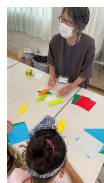
勉強後は折り紙も