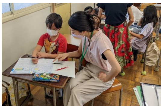
難しい計算も一緒にすれば大丈夫