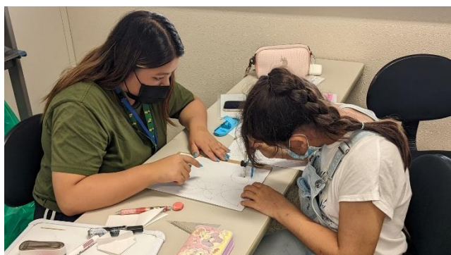
2学期に備えてコンパスの練習