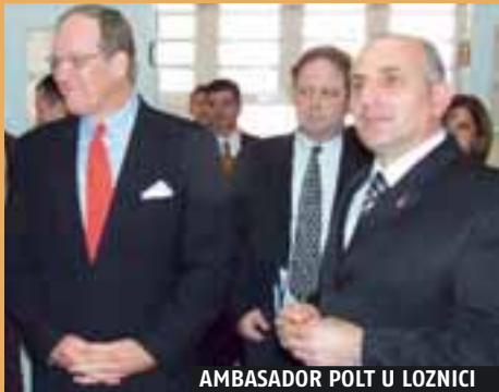
AMBASADOR POLT U LOZNICI

Ova kancelarija je osnovana kao zajednički projekat programa za Podsticaj ekonomskom razvoju opština (MEGA) i Programa za revitalizaciju zajednice kroz demokratsku akciju – Ekonomija (CRDA-E), koji finansira američki narod preko Američke agencije za međunarodni razvoj (USAID). Kancelarija za lokalni ekonomski razvoj biće zadužena za implementaciju opštinskih strateških planova za ekonomski razvoj, privlačenje novih stranih i domaćih investicija, kao i pružanje usluga postojećim investitorima.