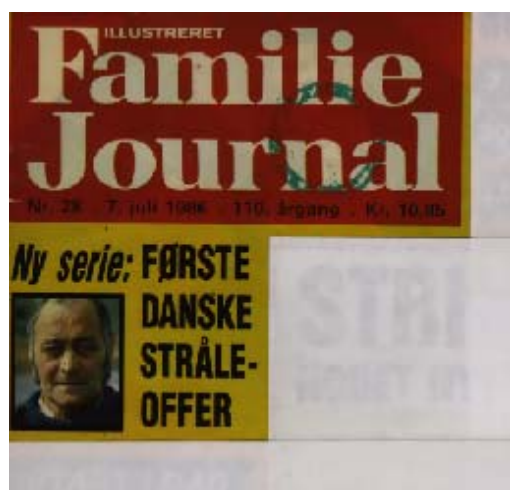
Figur 1. Forside fra Familie Journalen 7. juli 1986.

Så vidt vides stammer den første artikel om Thule-arbejdernes helbredsproblemer fra Familie Journalen den 7. juli 1986, figur 1.