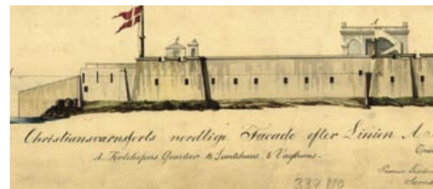
Fort Christiansværn's nordlige facade – udsnit af plan over Fort Christiansværn på Sankt Croix, tegnet 1836 af løjtnanterne Giellerup og Friis (Kort og Tegnings-samlingen 25, 337, 110).

man ikke behøver at tænke selv, men bare følger de planlagte stier. På De Dansk Vestindiske Øer er det en dødsynd at være planfølger. Øerne er en opdagelsesrejse i den danske historie – et paradiset med torne, der giver en klar forståelse af, hvem vi er – og hvem vi har været.