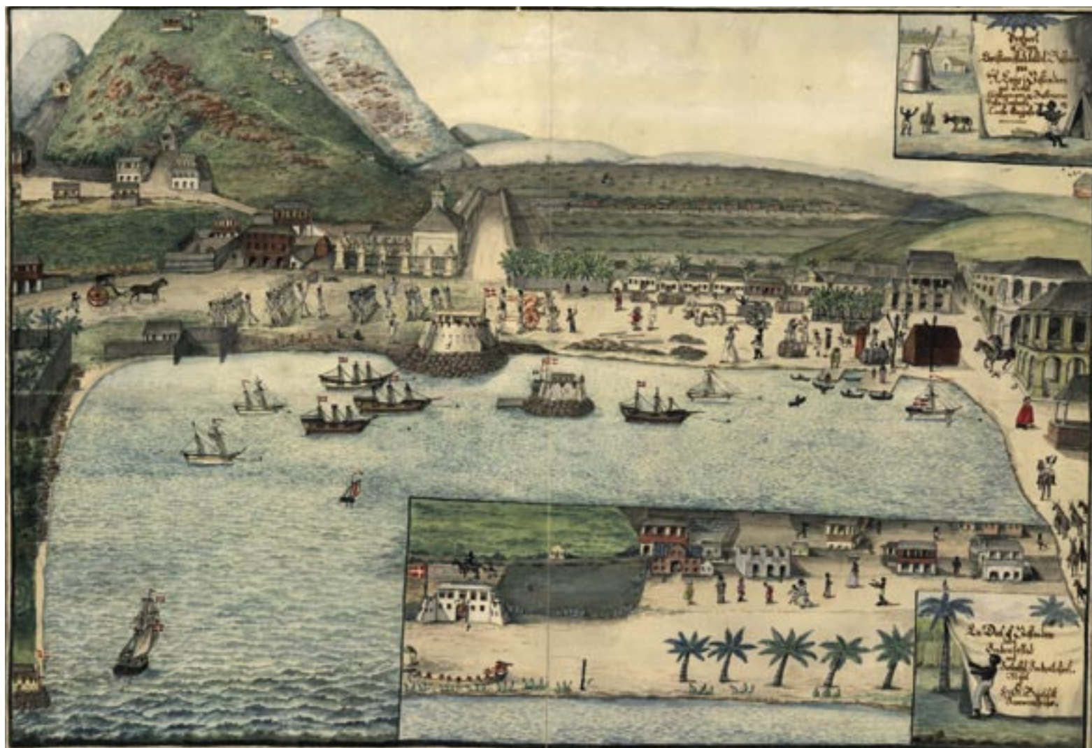
Prospect af Byen Christiansstad, kaldet bassinen, på Sankt Croix i Vestindien med fortet Christiansværn. Malet af H.G. Beenfeldt 1815 (Kort- og Tegnings-samlingen 25, 337, 211a).