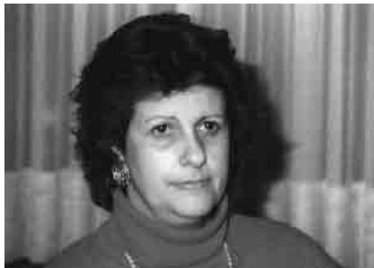
Elena Alfaro 2001 in Nürnberg

Elena Alfaro lebt heute in Paris. Sie wurde von der französischen Regierung im April 2006 mit dem „Ordre National de la Légion d'Honneur“ für ihr besonderes Engagement im Dienst der Menschenrechte, der Wahrheit und der Gerechtigkeit in Argentinien ausgezeichnet.