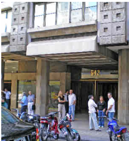
Maipú 942, ehemaliger Sitz der Botschaft der Bundesrepublik Deutschland