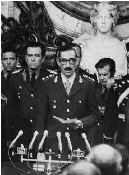
General Jorge Videla

Dabei erregte das „Verschwindenlassen“ von Menschen weltweit Aufsehen. Die Menschen wurden von zivil gekleideten oder uniformierten Sicherheitskräften verschleppt und in geheime Gefangenenlager gebracht, wo sie gefoltert und in den meisten Fällen anschließend ermordet wurden. Insgesamt wird die Zahl der „Verschwundenen“ von argentinischen Menschenrechtsorganisationen für die Jahre 1976 - 1983 auf 30.000 geschätzt.