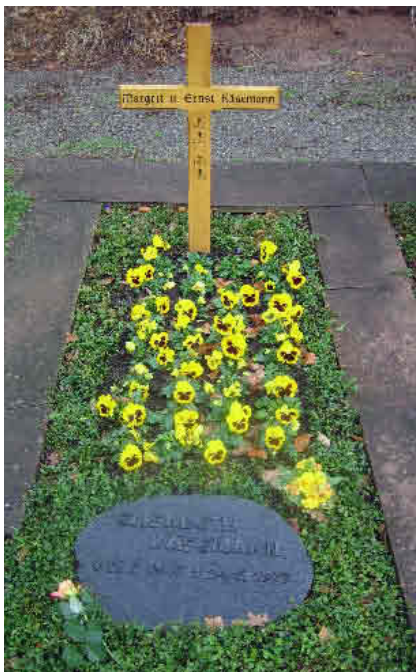
Grab Elisabeth Käsemanns am Lustnauer Friedhof

Der bekannte Theologe und Kollege Ernst Käsemanns, Jürgen Moltmann, hielt die Trauerrede. An die Familie richtete er die Worte: „Eure Elisabeth hat ihre Liebe und ihre Hoffnung der Befreiung eines erniedrigten Volkes gewidmet, damit der Raum weit werde für den Armen und die Bedrängnis ein Ende finde! Auf diesem Weg zur Freiheit der anderen ist sie den Bedrängern des Volkes zum Opfer gefallen. Sie ist in die Gemeinschaft der ungezählten, der namenlosen Opfer von Gewalttaten eingegangen.“