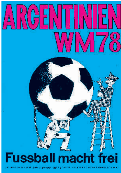
Informationsplakat der Kampagne Fußball und Folter 1977