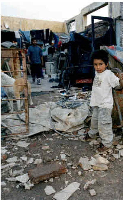
Armenviertel in Buenos Aires