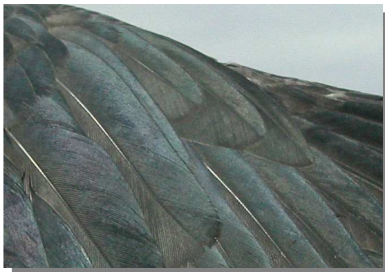
Grajilla. Juvenil: diseño del álula (18-VI).