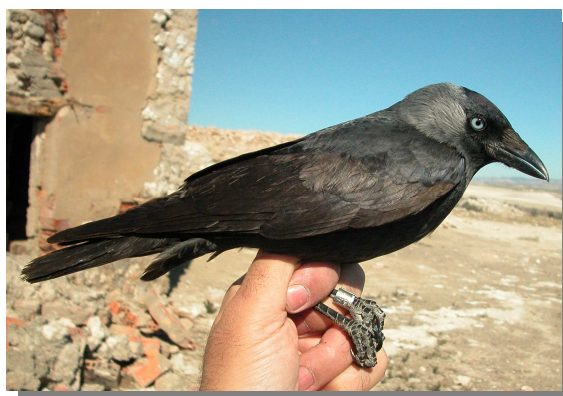
Grajilla. 2º año (11-III).

Especie sedentaria. Repartida por toda la Comunidad, faltando sólo en gran parte del Pirineo y de presencia dispersa en la Cordillera Ibérica.