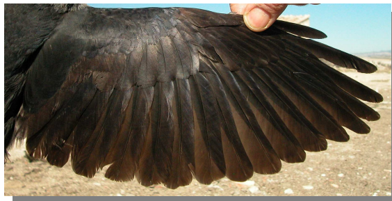
Grajilla. 2º año: diseño del ala (11-III).