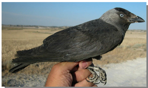
Grajilla. Adulto (28-V).