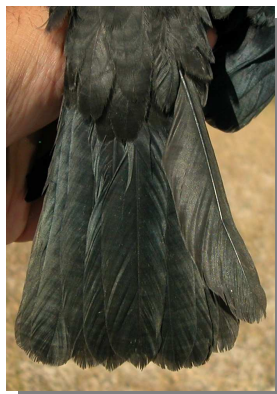
Grajilla. Desgaste de la cola y diseño de la pluma más externa: arriba izquierda adulto (28-V); arriba derecha 2º año (11-III); izquierda juvenil (18-VI).