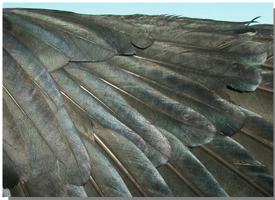
Grajilla. Adulto: diseño del álula (27-IV).