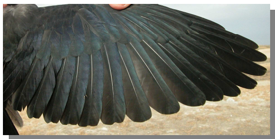
Grajilla. Juvenil: diseño del ala (18-VI).