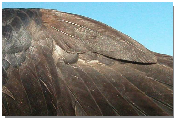
Grajilla. 2º año: diseño del álula (11-III).