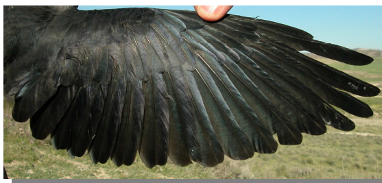
Grajilla. Adulto: diseño del ala (27-IV).