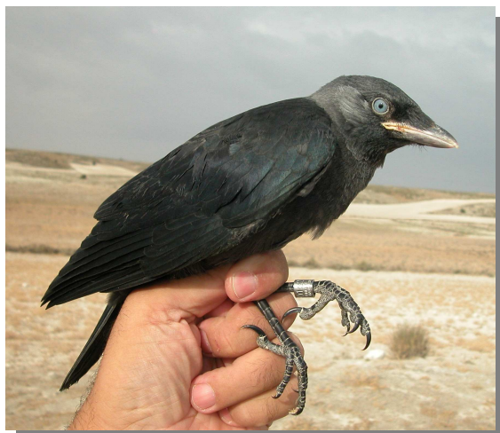
Grajilla. Juvenil (17-VI).