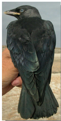
Grajilla. Diseño del dorso: arriba izquierda adulto (28-V); arriba derecha 2º año (11-III); izquierda juvenil (18-VI)