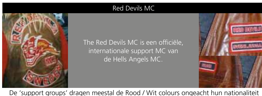
Figuur 2 – De kleding van een supportclub