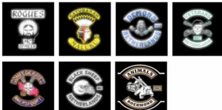
Figuur 1 – De logo's van de Raad van Acht, uitgezonderd de Hells Angels

Tijdens een zoeking in oktober 2005 bij een full colour Hells Angel uit Kampen werden notulen aangetroffen van de "Raad van 8 meeting d.d. 12 maart 2005". Daaruit bleek onder andere dat de Veterans van de lijst met "Front Patch M.C." werd afgehaald en werd toegevoegd aan de lijst met "Full Colours M.C.". Ook werden er twee lijsten aangetroffen met front patch MC (update 12 mei 2005) en de full colours MC (update 2 mei 2005). Hierin stonden enige wijzigingen ten opzichte van de lijst van 20 juni 2003. Dit impliceert dus dat de status van een MC kan veranderen, maar pas naar oordeel van de Raad van Acht.