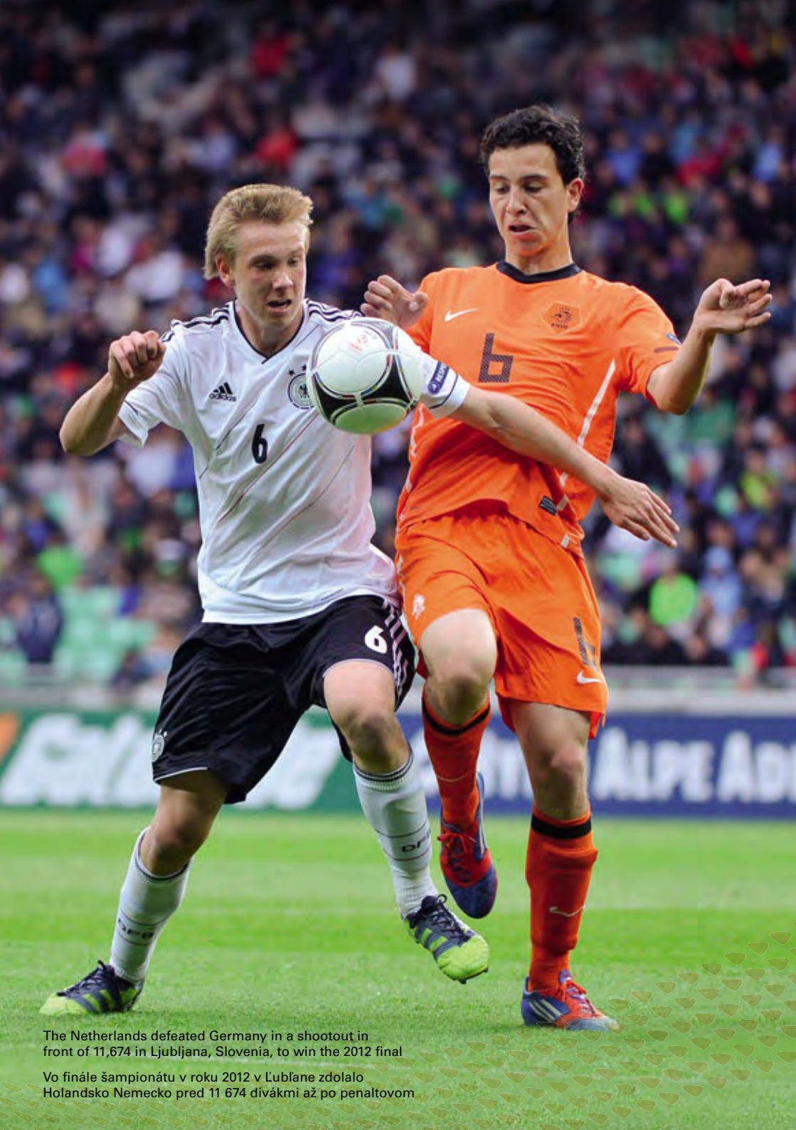
The Netherlands defeated Germany in a shootout in front of 11,674 in Ljubljana, Slovenia, to win the 2012 final