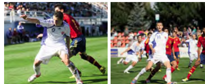
Slovakia forward Nikolas Špalek (left) and defender Denis Vavro (right) Slovenský útočník Nikolas Špalek (vľavo) a obranca Denis Vavro (vpravo)

See UEFA.com for official squad list Pre oficiálnu zostavu pozri UEFA.com