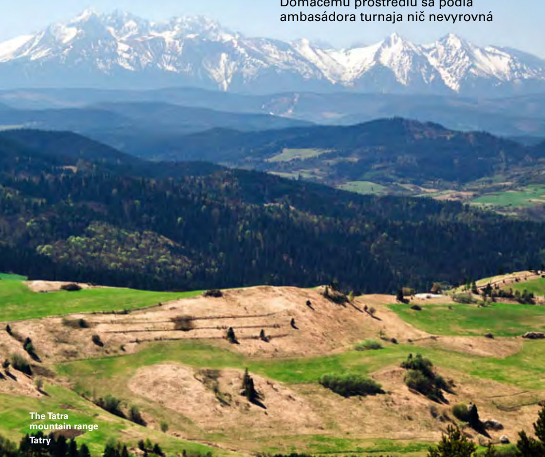
The Tatra mountain range Tatry

Domácejmu prostrediu sa podľa ambasádora turnaja nič nevyrovná