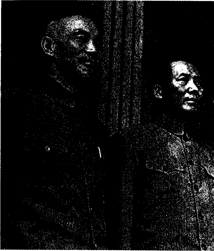
מאו דזה-דונג וג'יאנג קאי-שק, שנת 1945

יפן – נפלה ההחלטה להטיל את פצצות האטום ולא לסמוך על דרך קונבנציונלית להכרעת האויב. כאן, בשאלה הנוגעת לסיום המלחמה בשנת 1945, מחשבת מאו והשקפתו הן רלבנטיות, שכן הניצחון על גרמניה וועידת פוטסדם ביולי 1945, שכונסה בעקבותיה, לא ציינו את סיום המלחמה העולמית; זו נמשכה כידוע עד כניעת יפן ב-14 באוגוסט.