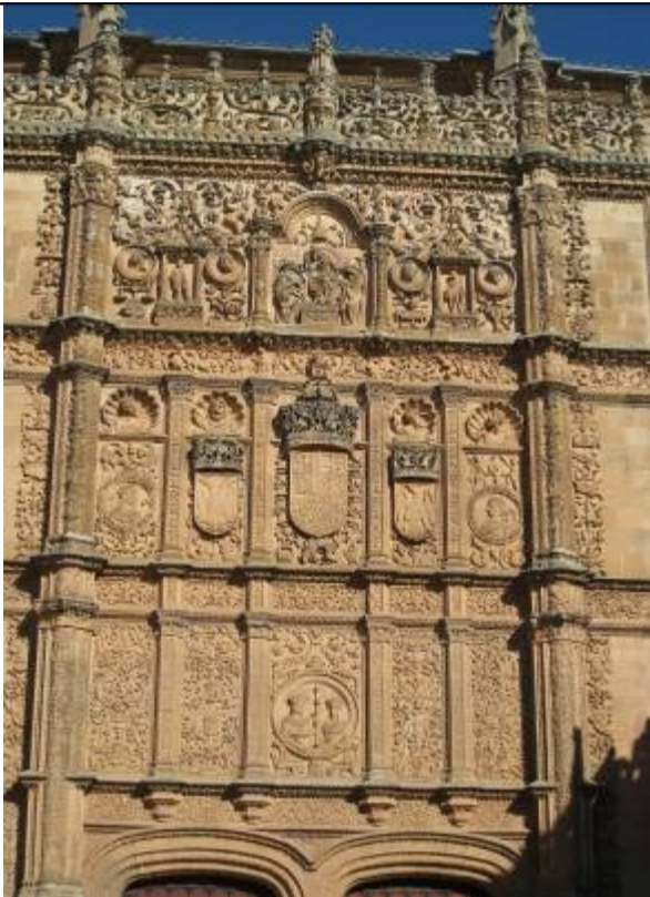
Fachada de la universidad

Ecrites avec du sang de taureau : les « victoires » de Salamanque