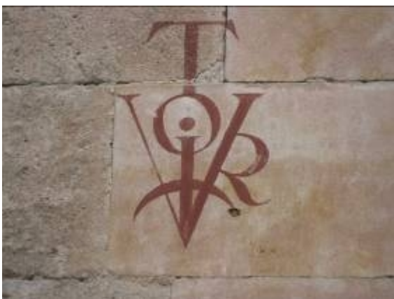
Un « vitor »