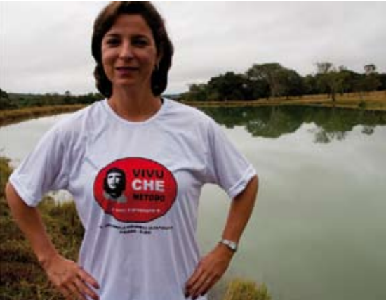
La pirata versio, far Eo-Asocio de Gojaso http://go.esperanto.org.br/p/

eksterseria pirata parodia epizodo Far Lino