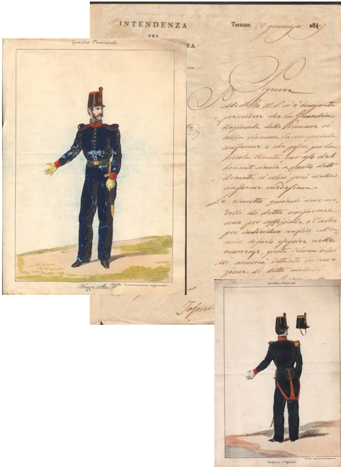
Uniformi della guardia nazionale, serie XV-5, b. 23, f. 142