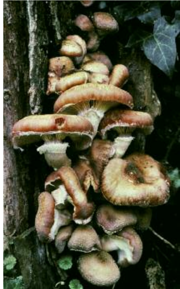
Fungas mealach Armillaria ostoyae

'S e balg-buachair a tha a' fàs ann an Aimearaga a-Tuath aon dhe na rudan as motha, as truime agus as sine air an talamh. Tha cuideam 150 tunna meatrach ann, tha e a' còmhdachadh 890 heactair agus tha e co-dhiù 2,400 bliadhna a dh'aois! Abair uilebheist, agus tha an aon fungas mealach Armillaria ostoyae ri fhaighinn ann an Alba!