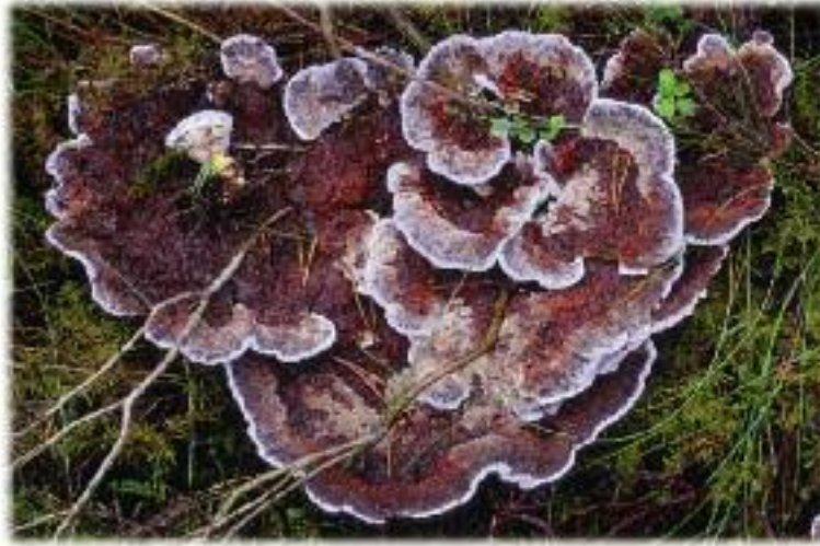
Fungas gorm bioranach