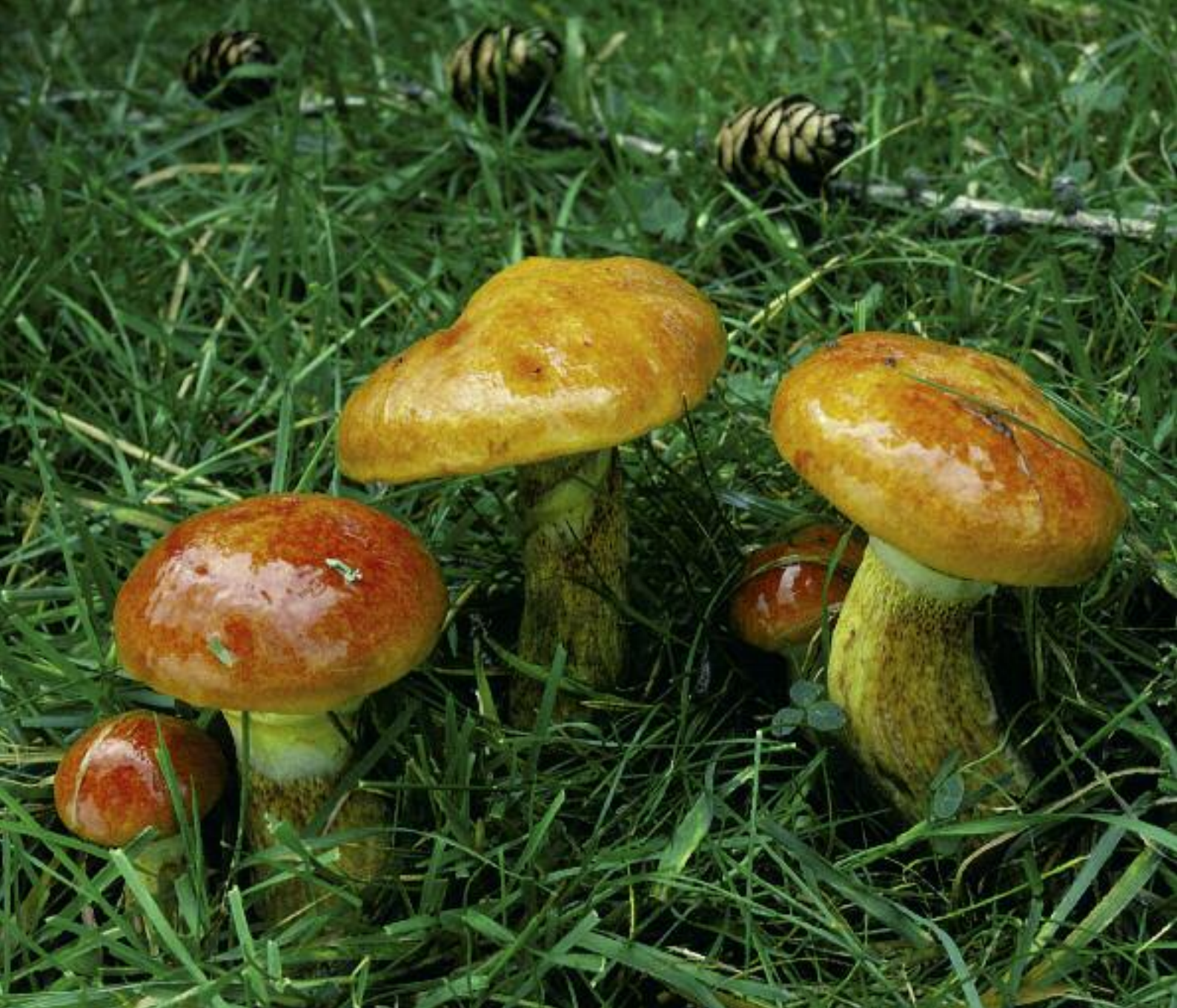
Jack sleamhain na learaig Suillus grevillei