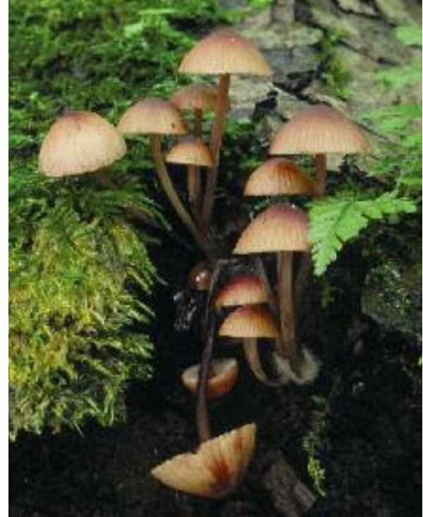
Mycena a' fàs air seann stoc Mycena haematopus

Tha seann raointean feurach, air nach deach mathachadh mèinnearach no giodar, agus gu sònraichte ma tha na raointean stèidhichte air ùir alcalach, a' toirt àite taic air leth do choimhearsnachdan fungais. Bho Phlana-gnìomha Bith-iomadachd Bhreatainn, chaidh sgrùdadh a dhèanamh air na balgan-buachair cupa-cèireach (gnè Hygrocybe ), a tha air leth datlach, agus air fungasan a tha gu tric co-cheangailte riutha, a gheibhear gu sònraichte ann an seann raointean feurach. Tha raointean dhen leithid seo air leth cumanta ann an Alba.