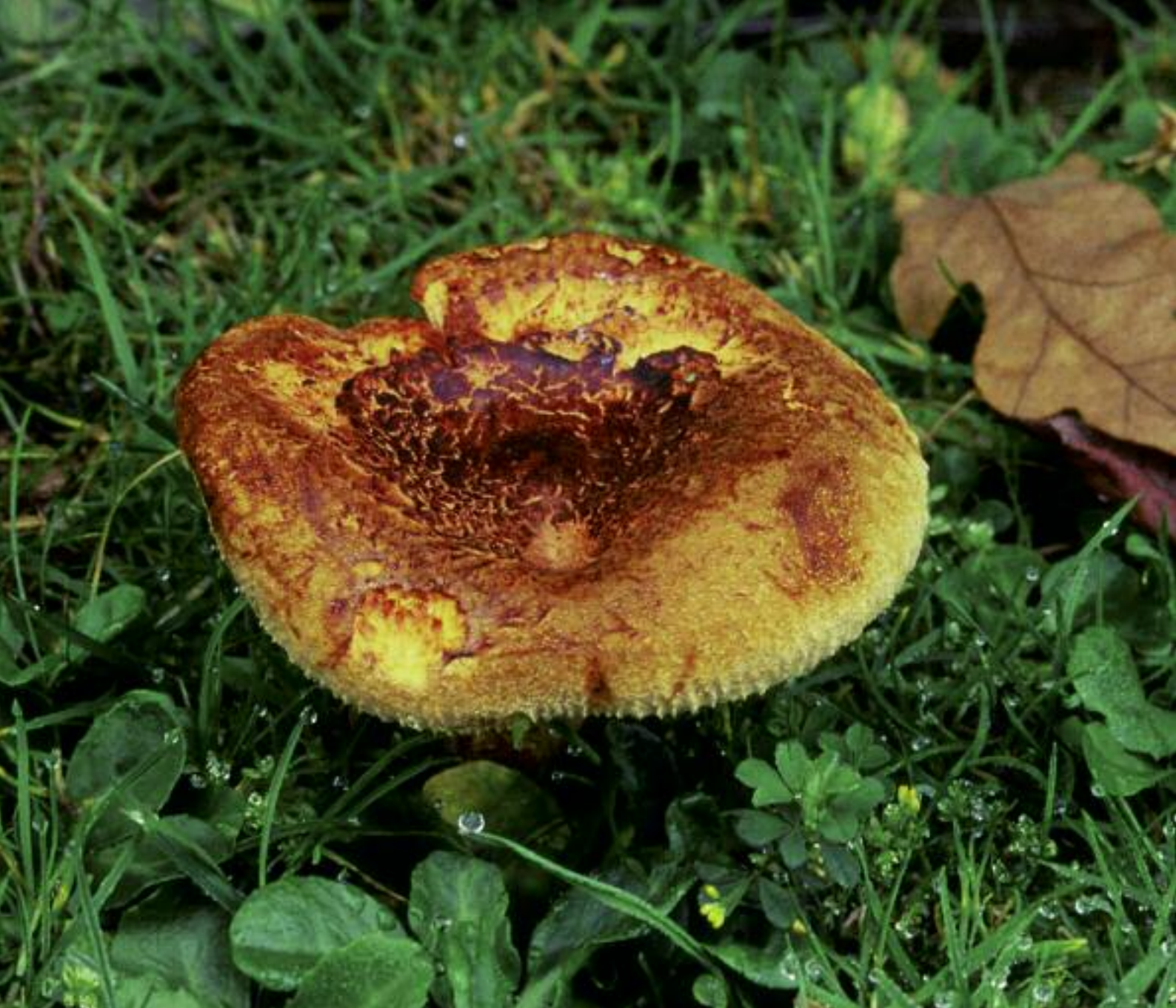
Oir chruinn dhonn Paxillus involutus