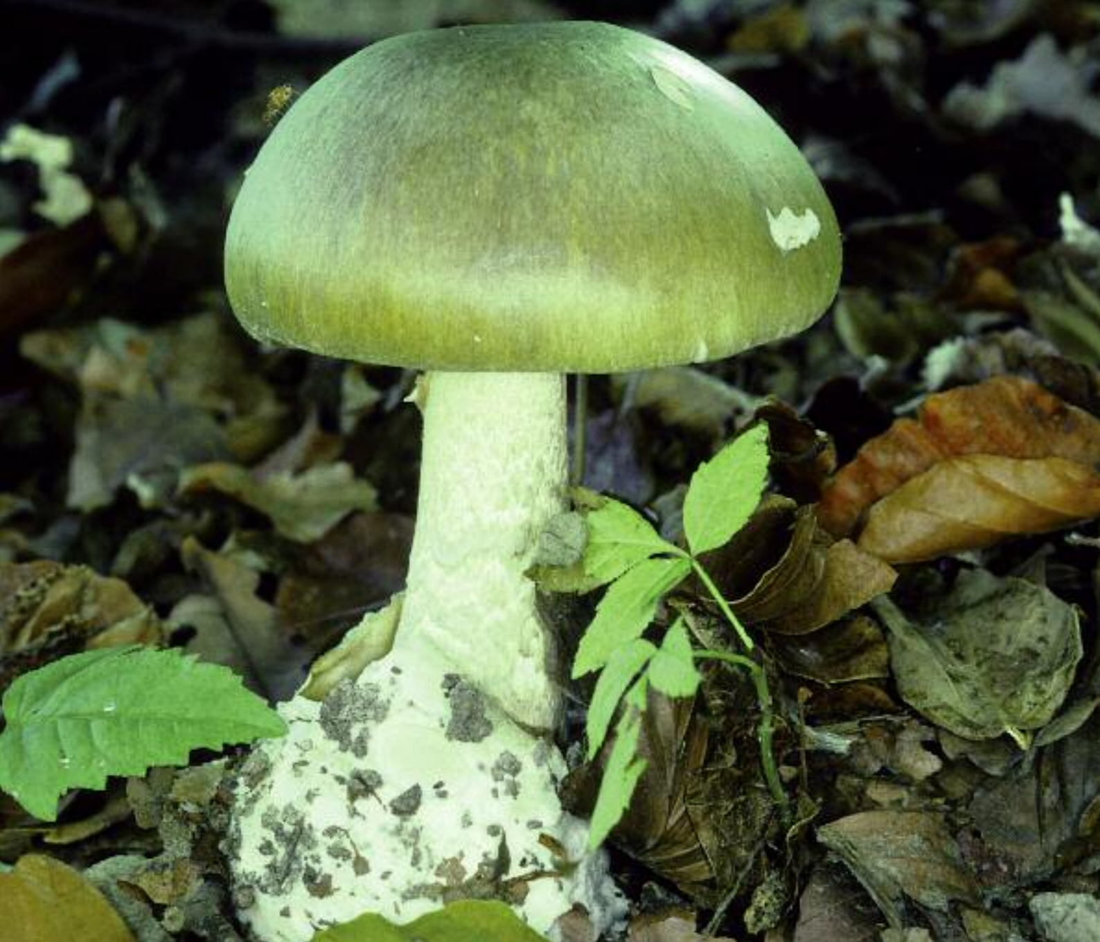
Cupa Bàis Amanita phalloides