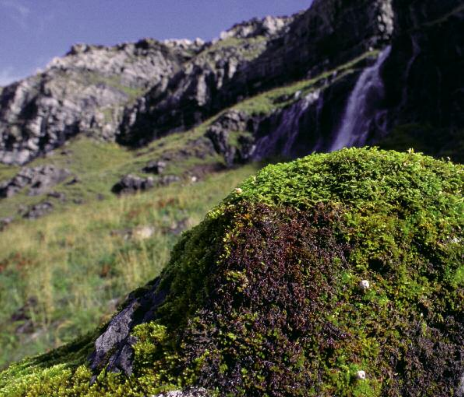
Ball-osaig cas-gheal – Innis nan Damh NNR Tulostoma niveum