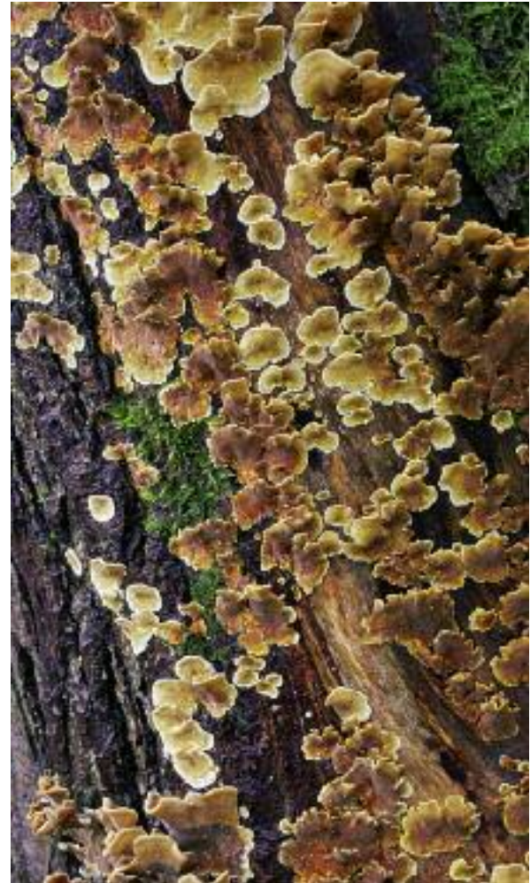
Saprotroph – Stereum molach

Nuair a tha fungas a' briseadh sìos sgudal, fiodh marbh agus salchair bheathaichean, tha beathachadh feumail air a sgaoileadh san ùir. Ged a tha am pròiseas seo sa chumantas feumail, faodaidh duilgheadasan nochdas nuair a nì mosgan ionnsaigh air fiodh ann an togalach. Canar saprotrophan no lobhadairean ri fungasan a bhios ag obrachadh mar seo.