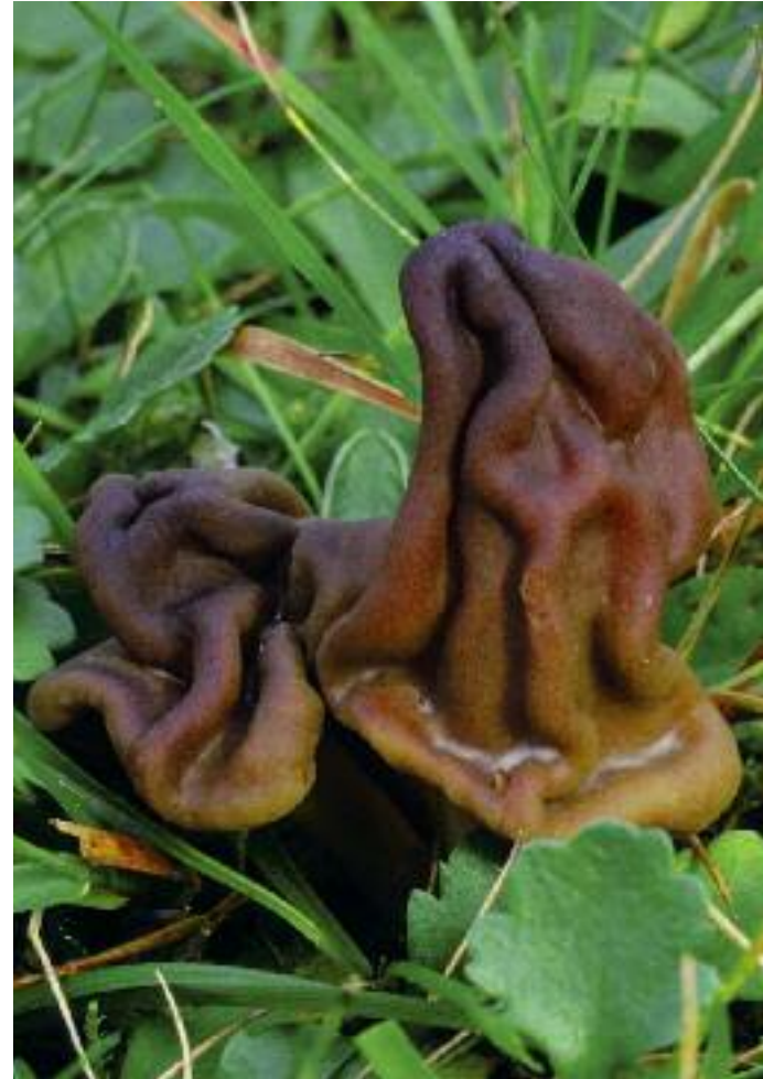
Teanga-talmhainn Microglossum olivaceum

Tha na seòrsaichean nach eil ann an cunnart air an liostadh ann am Plana-gnìomh Bith-iomadachd Bhreatainn (PBB): tha àireamhan sònraichte de chòrr is leth dhiubh seo ann an Alba. Ged a tha am PBB air ìomhaigh fhungasan a shoilleireachadh am measg bhith-eòlaichean san fharsaingeachd, tha e cuideachd air an cuid ìomhaigh a mheudachadh am measg an t-sluaigh air fad, agus tha seo buileach cudromach. Ann an Alba, tha am PBB a' cuimseachadh gu sònraichte air raointean feòir agus air na fungasan cupa-cèireach agus teanga-talmhainn a gheibhear annta, coilltean agus àrainnean far a bheil giuthas Albannach le an cuid fhungasan fiaclach, agus coilltean darach-calltainn a tha a' toirt taic dha fungus glaoth agus miotagan-calltainn.