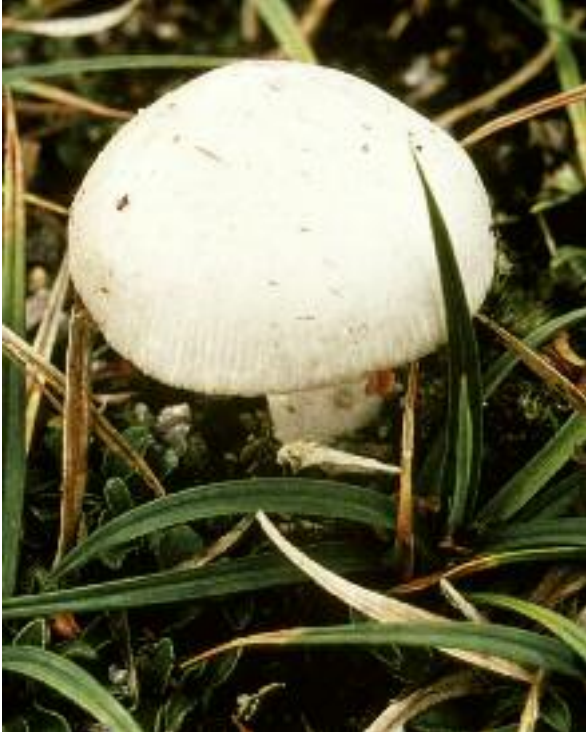
Amanita sneachda còmhla ri meanbh-sheileach Amanita nivalis

Tha seann raointean feurach, air nach deach mathachadh mèinnearach no giodar, agus gu sònraichte ma tha na raointean stèidhichte air ùir alcalach, a' toirt àite taic air leth do choimhearsnachdan fungais. Bho Phlana-gnìomha Bith-iomadachd Bhreatainn, chaidh sgrùdadh a dhèanamh air na balgan-buachair cupa-cèireach (gnè Hygrocybe ), a tha air leth datlach, agus air fungasan a tha gu tric co-cheangailte riutha, a gheibhear gu sònraichte ann an seann raointean feurach. Tha raointean dhen leithid seo air leth cumanta ann an Alba.