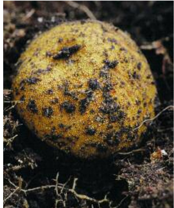
Balg-losgairn Hart Elaphomyces granulatus

Tha feadhainn dhe na fungasan a tha a' gintinn a-mhàin leis am mycelium, a tha falaichte san ùir, san lus no san fhiodh. Bidh am mycelium a' roinneadh ann an dà phàirt, no barrachd, agus tha gach roinn comasach air fàs mar fhungas air leth.