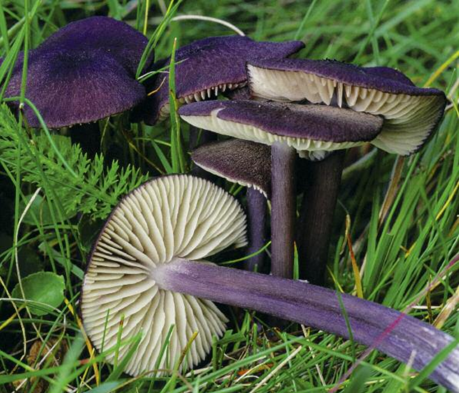
Leptonia purpaidh a' fàs ann an raon feòir Leptonia nigroviolacea