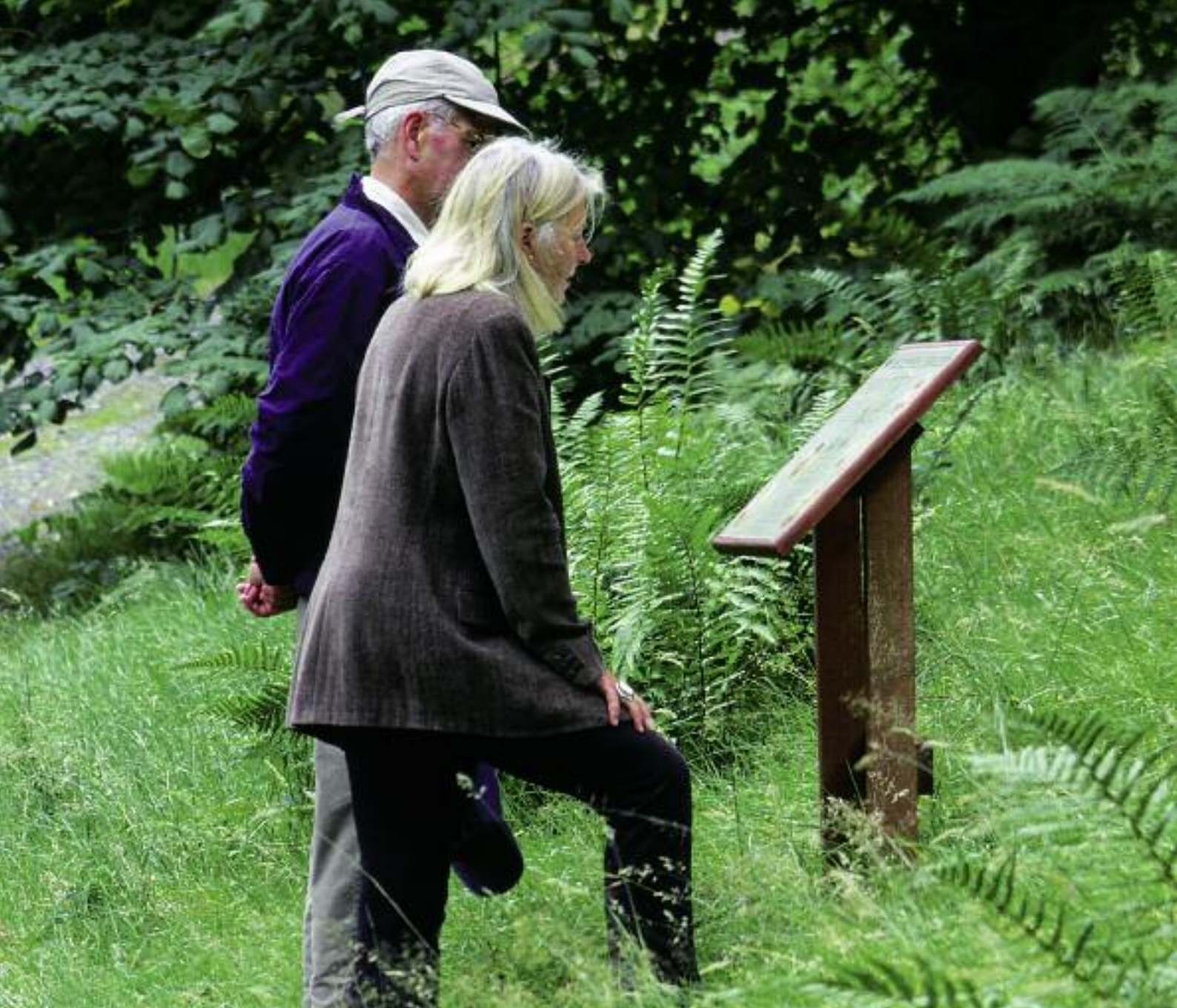
Tèarmann Coille a' Chorra-ghrithich, Gàrradh Luibheanach Dawyck.