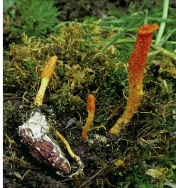
Necrotroph – Fungas burras dearg Cordyceps militaris

Canar necrotrophan ri fungasan a mharbhas feadhainn de cheallaichean an lus no a' bheathaich, no fiù 's fungas eile, air a bheil iad. Mar as trice, cha mharbh seo an lus, no am beathach. Tha iad seo a' gabhail a-steach meirg - agus fungas smut, fungas microscopach, a tha càirdeach dha balgan-buachair, agus a dh'fheumas lus a tha ri fàs, 's bidh am fungas a' toirt ionnsaigh air na fàilleanan òga. Mar sin, 's e parasaithean a th' annta. Tha fungasan eile a' dèanamh uiread de mhilleadh 's gun toir e bàs air an rud, 's an uair sin, beathaichidh am fungas air a' chorp mharbh. Tha feadhainn de bhalgan-buachair mòra sa bhuidheann seo, agus 's e necrotrophan a chanar riutha. Gu fortanach, chan eil mòran fhungasan ann an Alba a tha ag adhbhrachadh tinneas ann an daoine, ach tha feadhainn ann a bheir bàs dha daoine, gu sònraichte ann an daoine a th' air a bhith air an lagachadh ann an dòigh air choireigin.