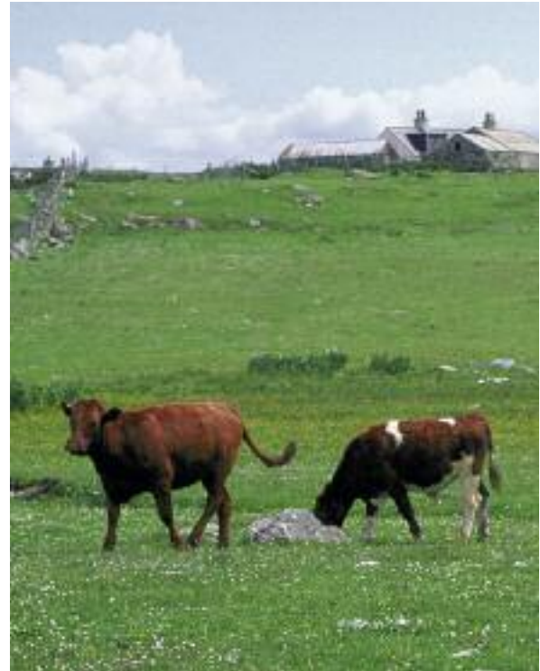
Crodh ag ionaltradh air àrainn a bhiodh freagarrach dha balgan-buachair cupa-cèireach

Aig Tuathanas Deuchainneach Sourhope ann an Crìochan na h-Alba, thathas ag obair air ìomhaighean ginteil fhaighinn airson bhalgan-buachair cupa-cèireach, agus air tuigse fhaighinn air pàtran an toraidh aca. Thathas ag amas air tuairmse a dhèanamh air iomadachd nam fungasan mòra, chan ann a-mhàin nuair a tha iad toradh san fhearainn, ach cuideachd, fon talamh anns na h-ionadan deuchainneach an dèidh diofar sgeamaichean mhathachaidhean is ceimigeach àiteachais.