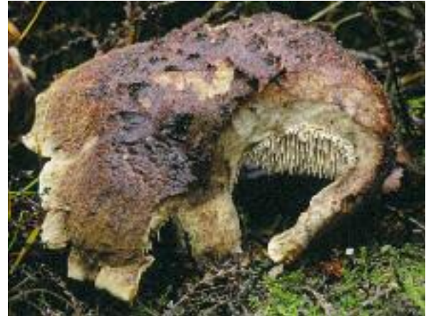
Fiacail lannach Sarcodon imbricatus