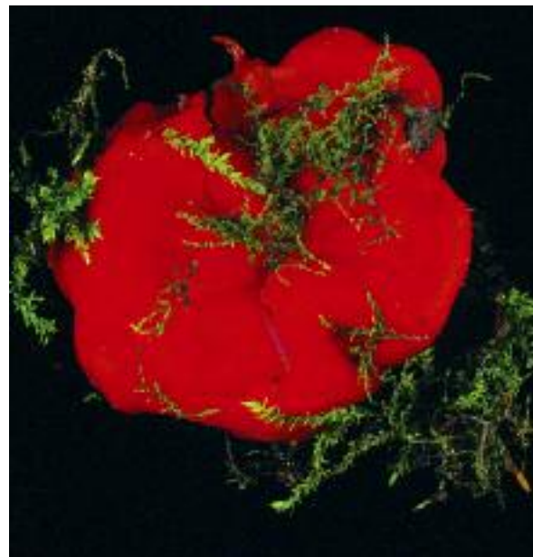
Balg-losgainn Sealan Nuadh Paurocotylis pila

Cha robh aon dhe na balgan-buachair as cumanta, agus as eòlaiche air a bheil sinn, Jack slipach na learaig, Suillus grevillei , san dùthaich seo o thùs a bharrachd. Chaidh a thoirt a Bhreatainn gun fhiosa faisg air deireadh na naoitheamh-linne-deug.