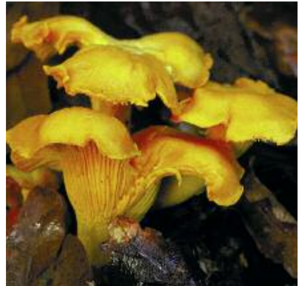
Chanterelle Cantharellus cibarius

sònraichte far nach robh rian no òrdugh air a' chruinneachadh. Air sgàth seo, thàinig buidheann ri chèile gus còd fhoillseachadh a bheireadh stiùireadh do dhaoine. Nam measg bha buidhnean glèidhteachais, uachdarain, daoine a bhios a' cruinneachadh agus a' ceannach bhalgan-buachair, agus rinn seo an-àirde Fòram Bhalgan-buachair Fìadhaich na h-Alba. 'S e a bhith a' stampadh orra a tha a' dèanamh a' mhillidh as motha, oir, le a bhith a' dùnadh nam beàrnan èadhair san ùir, agus a bhith ag atharrachadh gluasad uisge, tha am mycelium air a mhilleadh.