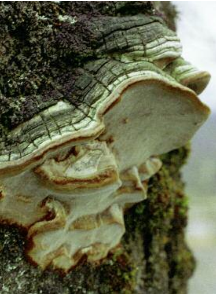
Fòman chrìtheannan Phellinus tremulae

Tha aon rud mu choilltean Bhreatainn a tha gan dealachadh bho choilltean ann an àite sam bith eile san t-saoghal. Gu tric, tha iad sgiobalta is glan, le craobhan a th' air tuiteam air an toirt air falbh. Ach ma thèid craobhan a thuit agus logaichean marbh fhàgail, bheir seo stòras bìdh dha fungasan, agus dha neo-dhrum-altachain, agus tha e deatamach ma tha iomadachd àite gu bhith air a ghleidheil. Tha fungasan ann a bhios a' briseadh sìos fiodh, agus a mhaireas, a-mach à sealladh, ann an rùsg craoibhe, agus tha iad torach cho luath 's a thuiteas geug chun na talmhainn. Ach tha fungasan eile a' cur feum air ùine gu math nas fhaide airson planntachadh mus bi iad torach, agus tha feadhainn de sheòrsaichean nach eil ri lorg ach a-mhàin ann an seann choilltean. Gu deimhinn, anns na dùthchannan Lochlannach, tha iad a' cleachdadh an raoin de dh'fhungasan a tha a' briseadh sìos fiodh airson aois coille a thomhas.