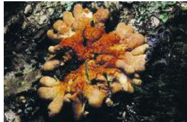
Miotagan calltainn Hypocreopsis rhododendri

Tha coilltean darach-calltainn air taobhan siar na h-Alba cuideachd a' toirt taic do dh'fhungasan a tha gann agus inntinneach. Nam measg, tha miotagan-calltainn, fungas de dhath buidhe-orainse, a th' air a liostadh bho Phlana-gnìomh Bith-iomadachd Bhreatainn, agus fungas glaoth. Chaidh iomradh an toiseach a thoirt air miotagan calltainn fon ainm saidheansail, Hypocreopsis rhododendri , ach b' ann ann an Aimearaga a-Tuath a bha seo, a' fàs air seòrsa de ròs-chraobh nach eil ri fhaighinn ann am Breatainn. Cha deach a lorg a-rimh air an ròs-chraoibh fàs-mhor, Rhododendron ponticum , a thàinig o thùs à Iberia, ach a tha a-nis cho cumanta ann an Alba. Chaidh fungas glaoth, Hymenochaete corrugata , ainmeachadh air sgàth 's gu bheil e a' glaothadh biorain mharbh de chraobhan calltainn ri na geugan a tha fhathast beò gu h-àrd: mar sin, cha thuit iad chun an làir, far am faigheadh fungasan eile air am briseadh sìos.