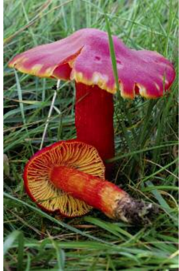
Cupa-cèireach dearg Hygrocybe punicea

Tha liostaichean ann mu-thràth air an deach aontachadh - liostaichean de dh'fhungasan cupach agus de chrotal Bhreatannach. 'S ann de dh'fhungasan Breatannach is Èireannach, ris an canar Basidiomycetes , a tha an liosta mu dheireadh a chaidh a chur ri chèile aig Gàrradh Luibheanach Rìoghail Kew. Ach tha mòran de bhuidhnean de mhicro-fungasan ann am Breatainn nach eil air an clàradh gu mionaideach, agus chan urrainn dhuinn ach tuairmse a thoirt air na th' ann dhiubh. Chan eil teagamh sam bith, ge-tà, gu bheil tòrr a bharrachd fungasan ann am Breatainn na tha de lusan flùrach - 's dòcha sia uiread.