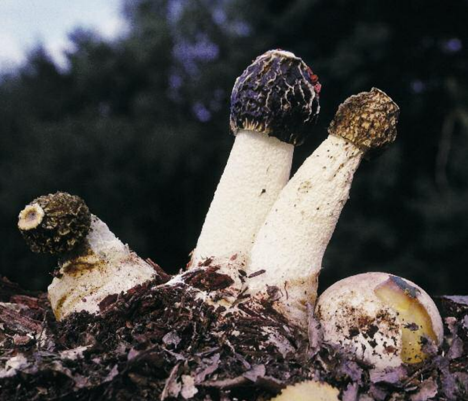
Adhairc-bhrèin chumanta Phallus impudicus