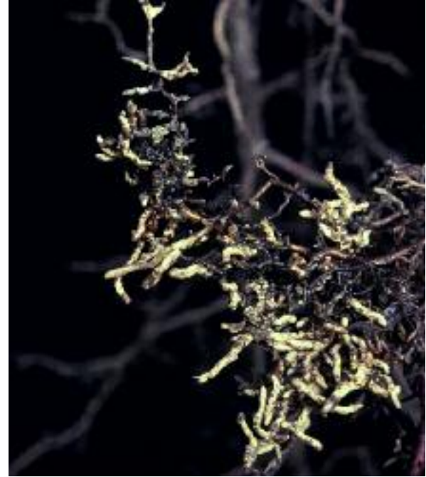
Freumhan Beithe le mycorrhiza

Tha fungasan ann a tha a' buannachadh bho foto-chochur leis an dàimh a th' aca le algaich. 'S e dàimh cho dlùth a tha seo 's gun robhas dhen bheachd, fiù 's gu meadhan na linne mu dheireadh, gum b' e aon fhàs-bheart a bh' annta, agus chaidh an t-ainm crotal a thoirt orra. Anns an dàimh eatorra, tha am fungas a' faighinn beathachadh bhon algaich, agus tha am fungas a' dìon an algaich airson nach tiormaich e an-àirde. Canar gu bheil an dàimh seo, agus na dàimhean ann am mycorrhiza sam bith, bith-trophach.