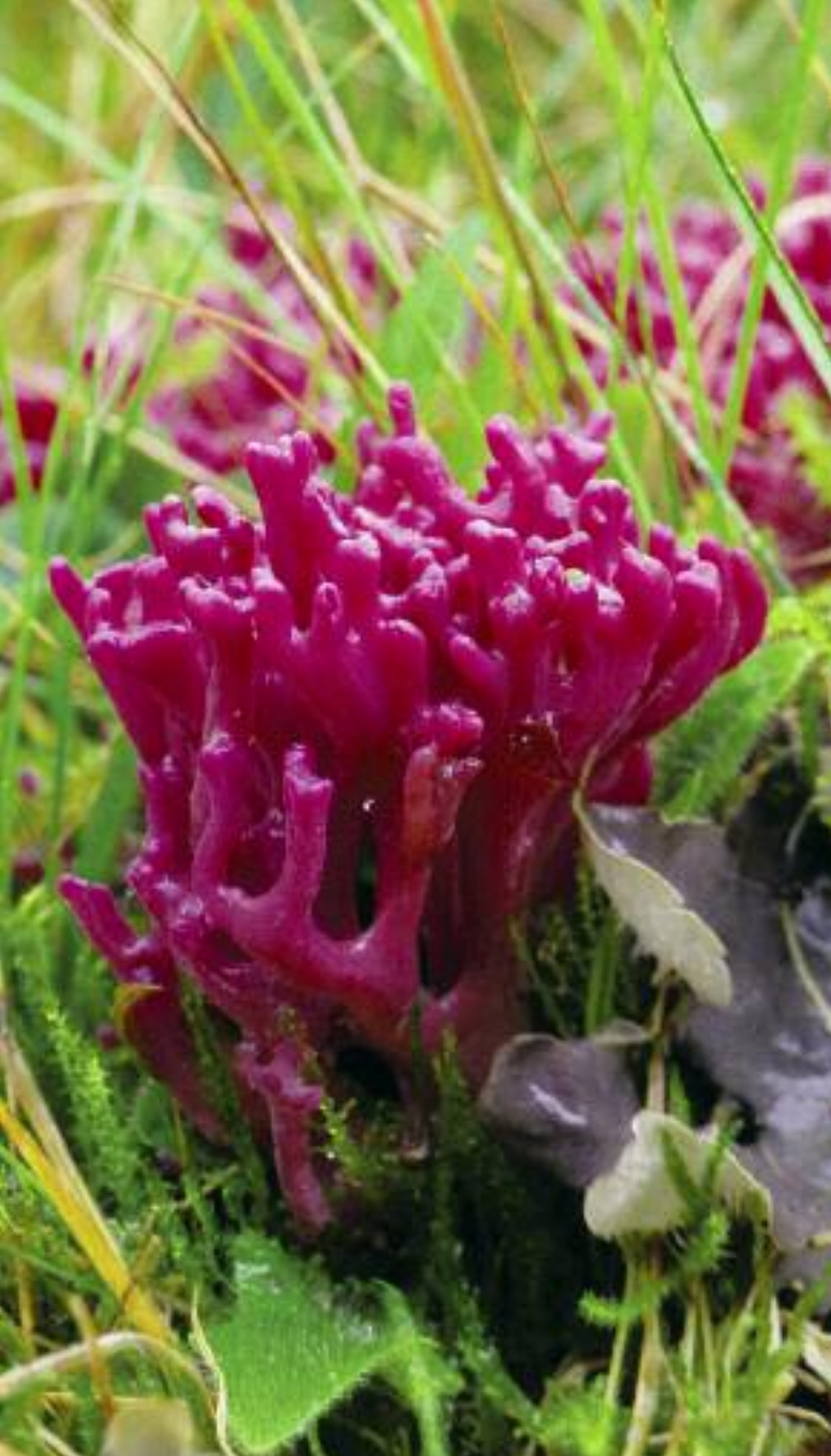
Corail bàn-dhearg Clavaria zollingeri