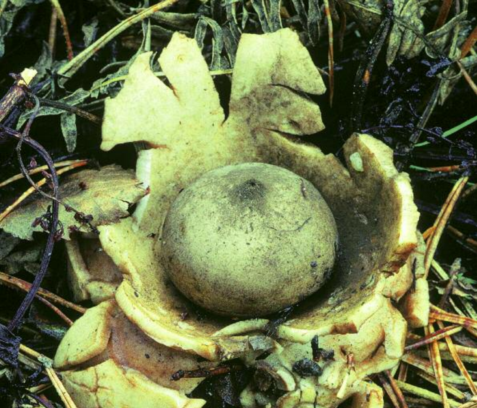
Rionnag na Talmhainn Gastrum triplex