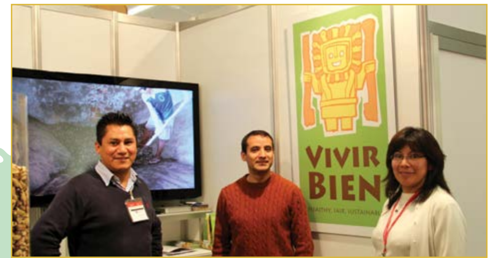
Ejecutivos de EBA en Alemania, Febrero de 2013

La apertura de esta filial en Alemania significa, sin lugar a dudas, un gran paso para construir la futura plataforma comercial de productos bolivianos en el mundo.