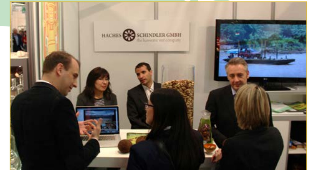
Participación de EBA en la Feria "Bio Fach 2013", en Núremberg, Alemania (Del 13 al 16 de febrero).

EBA Europe, del Servicio de Desarrollo de las Empresas Públicas Productivas (SEDEM), ya ha firmado contratos para vender castaña al mercado europeo por más de 3,5 millones de dólares.