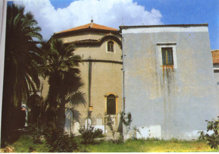
Santa Maria Katolik Kilisesi'nin batıdan genel görünüşü.

görüldür. Şapellerin bahçe yönüne bakan üçer penceresi vardır. Doğu cephesi batı yönündekilere benzemekle birlikte, bemaya bitişik mekan (Synthronon) bu kez kilise bakıcısının evine yanaşmıştır. Güney - doğuda en üstte baldaken şeklinde bir çan kulesi yer almaktadır.