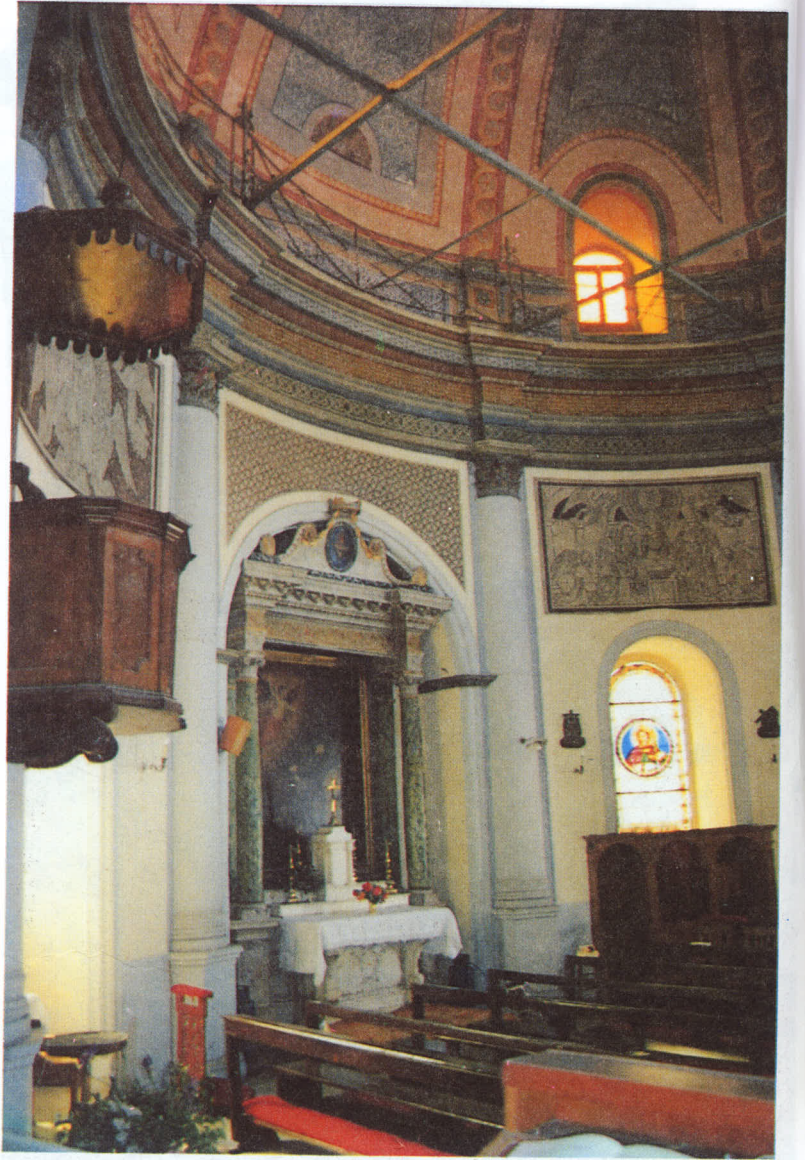
Naos'un kuzeyi, içten görünüş

Yapı, adından da anlaşıldığı gibi Meryem Ana'ya ithaf edilmiştir. 1831'de yapıldığı kitabesinden anlaşılmaktadır. □