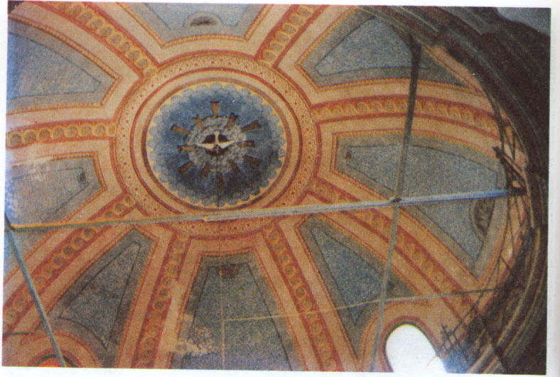
Naos'un üzerini örten kubbe

tilmiştir. Üçgen dilimlerle hareketlendirilen giriş kemerinin ortasında kıvrım dallar, yanlarında ise girland motifleri vardır. Üst kısımda ise yapıya ait kitabe dik-katimizi çekmektedir.