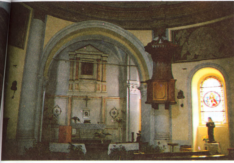
Naos'tan bema'ya bakış