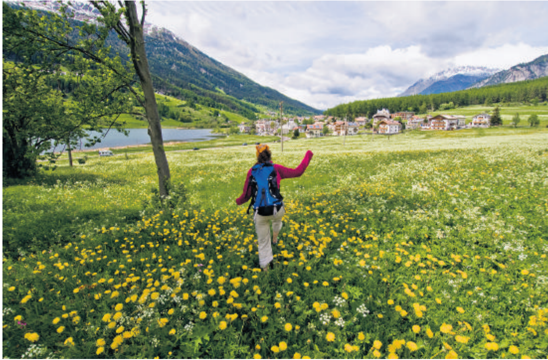
Grünes Hochtal: St. Valentin auf der Haide, Haidersee

«Da haben Sie was vor sich», meint die Servierfrau in der Pension Paflur und weiss von Leidensgeschichten erschöpfter Wanderer zu berichten. Also gehen wir den längsten Tag mit der nötigen Vorsicht an. Das wilde Gandriatobel, das enge Schlandraunertal, dann wieder auf schmalen, weich gefederten Wegen durch lichten Wald, Waldweiden, durch die gemächlich grasende Kühe ziehen, Berghöfe mit nichts als Himmel und steilen Wiesen rundum. Noch vor ein, zwei Generationen hausten hier »die Erben der Einsamkeit«, vom Fotografen Flavio Faganello in