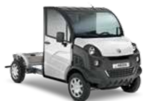
BASE CHÂSSIS CABINE