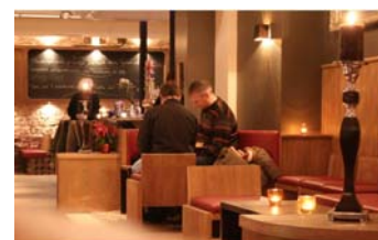
Tafelspitz &amp; Söhne

Neben Neuansiedlungen verändern aber auch Umsiedlungen bereits existierender Geschäfte das Erscheinungsbild der City. Daher ist es eine wichtige Aufgabe des City Managements, im Zuge der Bestandspflege Geschäfte und Dienstleister am Standort zu halten und ihre Entwicklung zu unterstützen.