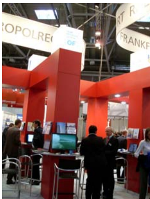
Gemeinschaftsstand EXPO Real 2008