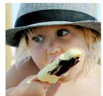
Kleinkinder nicht unbeaufsichtigt essen lassen.