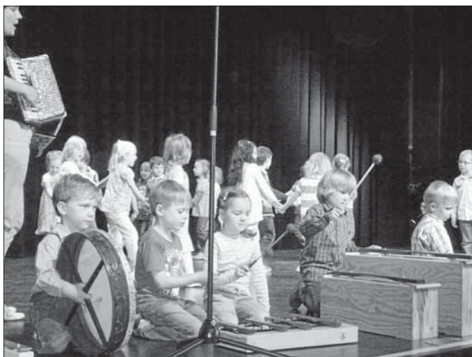
Die Kinder der Musikalischen Früherziehung musizieren konzentriert

Mehrere Kurse der Musikalischen Früherziehung hatten sich passend zur Gartenschau eine besondere Geschichte ausgedacht: Die fünf- und sechsjährigen Kinder gestalteten mit Singen, Tanz und Orffschem Instrumentarium die Aufstellung einer Skulpturenlandschaft in einem Garten.