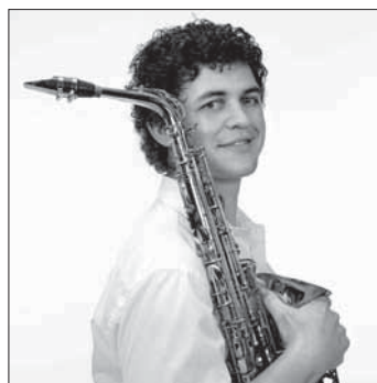
Christian Segmehl kommt, um jungen Saxophonisten seine Tricks zu zeigen.

Am Samstag, den 15. Juni kommt er zum zweiten Mal zu einem Saxophon-Workshop nach Sigmaringen und gibt jungen Saxophonisten die Möglichkeit, neue musikalische und technische Impulse zu bekommen. Der ganztägige Workshop umfasst neben der Erarbeitung von individuell vorbereiteter Literatur auch das Spielen im Ensemble sowie Gruppenstunden zu den Themenfeldern Ansatz, Blatt / Mundstück-Kombination, Atmung, Körperhaltung, Fingertechnik sowie Tipps und Tricks zu effizienterem Üben.