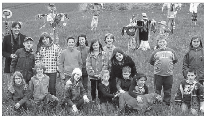
Schüler der Klasse 3b der Laizer Grundschule präsentieren ihre Vogelscheuchen