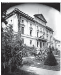
Blick vom Parterre auf den Neuen Prinzenbau, um 1890