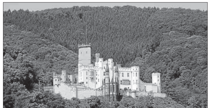
Burg Stolzenfels