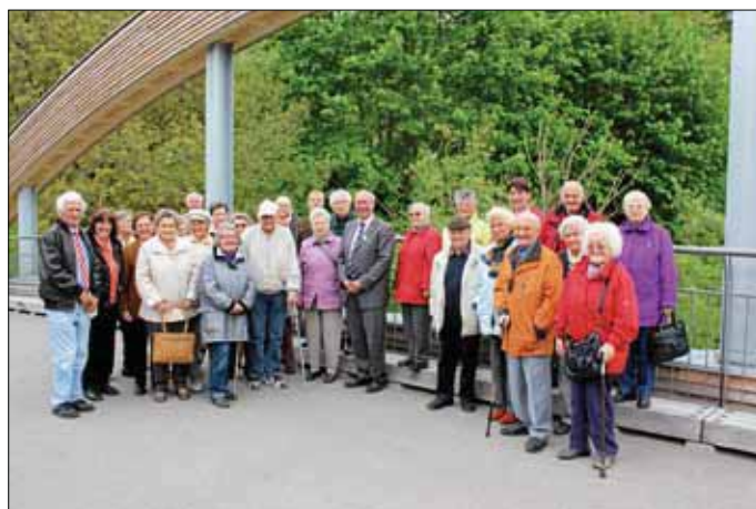
Gruppenaufstellung auf der Gutensteiner Holzbrücke

Vergangene Woche erlebten 30 Seniorinnen und Senioren ihre Heimatstadt auf eine neue Weise. Bürgermeister Thomas Schärer unternahm mit den Senioren eine Busrundfahrt und schlüpfte in die Rolle eines Stadtführers. Die Rundtour durch Sigmaringen begann am Skulpturenpark im Prinzengarten und führte weiter zum Neubaugebiet Schafswiese. Weiter auf dem Besichtigungsprogramm standen der Neubau des Chemischen und Veterinäruntersuchungsamts, der Adlerplatz und die Streuobstwiese in Laiz sowie die Holzbrücke in Gutenstein. Zum Abschluss lud Bürgermeister Schärer die Senioren zu einer Gesprächsrunde mit Kaffee und selbstgebackenem Hefezopf ins Sigmaringer Rathaus ein.