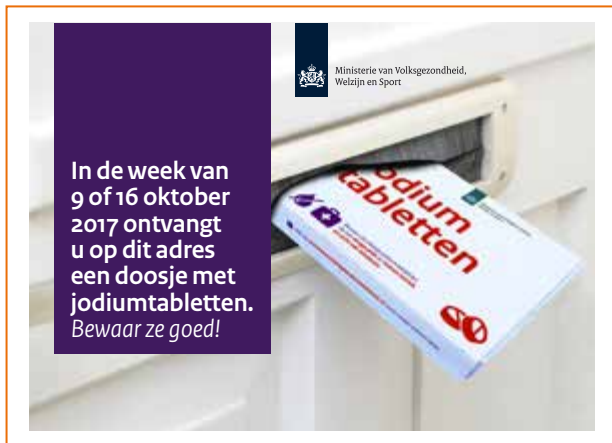
Voorbeeldadvertentie distributie jodiumtabletten

In de week van 3 oktober 2017 ontvangen de inwoners van de 0-20 kilometerzones en de 20-100 kilometerzones een vooraankondiging per post en via social mediakanalen.