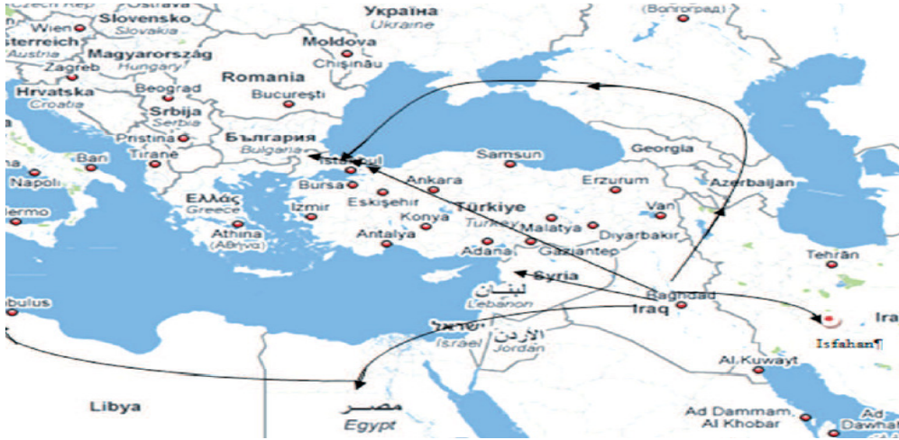
Karayların Göç Yolları (Dr. Tülay Çulha'dan alınmıştır.)

İlerleyen zamanlarda cemaat üyeleri, mezheplerini yaymak üzere çeşitli bölgelere dağılırlar. Bu dönemde Karaylar doğuda İran'a, batıda Bizans'a ve kuzeyde Azerbaycan üzerinden ve Bizans'tan önceki dönemlerde Suriye, Filistin, Kudüs'ten göç etmek mecburiyetinde kalan bu topraklardan çıkarılan Museviler Ermenistan üzerinden Hazar ülkesine gelmiştir. Böylece Hazar Türkleri 750-760 yılları arasında Karai Musevilikle tanışmıştır.