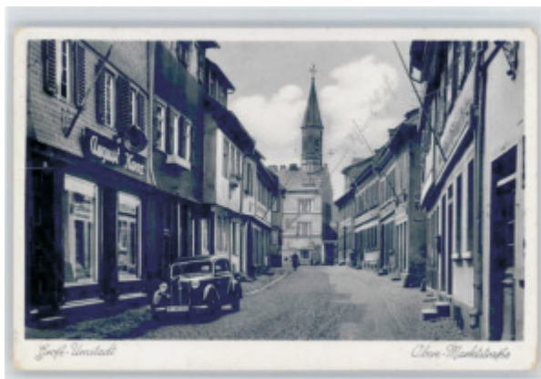
Die ‚frühere‘ Obere Marktstraße