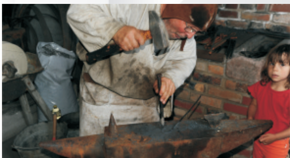
Die Schmiede im Gruberhof

Im Gruberhofmuseum, Raibacher Tal 22, präsentieren in direkter Nachbarschaft zur Bleiche (s.u.) der Umstädter Museums- und Geschichtsverein und der OWK Groß-Umstadt Brauchtum und Handwerk. Auf dem Verbindungsweg zwischen Gruberhof und Bleiche brät, grillt und kocht der OWK deftige Speisen, im Gruberhof sorgt der Museumsverein für Getränke, Kaffee und Kuchen.