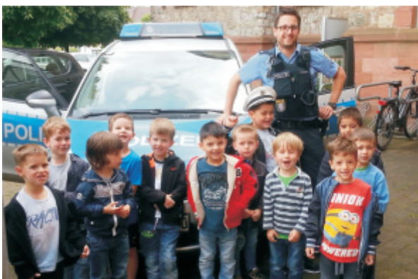
Polizei zu Besuch in der Kita KIZ

Die Polizeistation in Dieburg ist zuständig für Babenhausen, Dieburg, Eppertshausen, Groß-Umstadt, Groß-Zimmern, Münster, Otzberg und Schaafheim. Zu den Aufgaben gehören u.a. Einsätze bei Demonstrationen, Kriminalitätsbekämpfung, Verkehrssicherheit, die Einsatzzentrale, von der alle Notrufe entgegengenommen und die Funkwagen gesteuert werden.