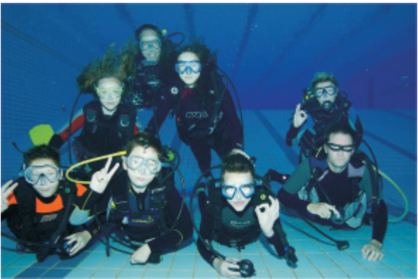
Tauchgruppe der Flinken Flossen

Im Fokus des Vereins steht sicheres Tauchen und jede Menge Spaß. Kinder ab 10 Jahren werden spielerisch im wöchentlichen Training auf das große Abenteuer Tauchen vorbereitet.