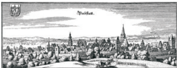
Merian-Stich von Umstadt, 1655

ten ausgestattet wurde. 1390 scheidet Fulda als Besitzer aus, sein Anteil geht an den Pfalzgrafen. 1504 besetzte Landgraf Wilhelm von Hessen im bayrischen Erbfolgestreit ganz Umstadt. Die Pfalz erhielt ihren alten Anteil zurück, der Landgraf den ehemals hanauischen Anteil zugesprochen. Der Dualismus Pfalz/Hessen, der bis 1803 dauerte, hat die Entwicklung der Stadt, besonders nach dem 30-jährigen Krieg, nicht zu fördern vermocht.