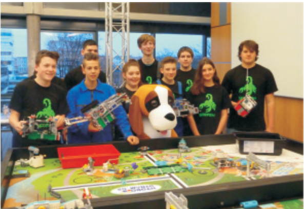
Die Roboter AG

Zu den Highlights der ERS gehören am Tag der Schulen die Bikeschool der Gesamtschule mit ihrer Fahrradwerkstatt und dem Fahrradtraining. Die Roboter AG zeigt von Schülern selbst gebaute und programmierte Roboter, unterstützt durch einen tollen Film in Dauerschleife.