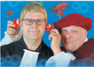
Musikkabarett vom Feinsten: Das Duo Camillo

Duo Camillo präsentiert Musikkabarett vom Feinsten, mitreißend, inspirierend und mit ansteckender Begeisterung – wobei sich die beiden besonders gerne mit den wundersamen Spielarten des Glaubens auseinandersetzen.