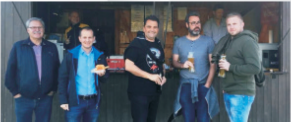
Das Team vom Grillwagen

Die Spielvereinigung 1928 Groß-Umstadt e.V. ist ein Fußball- und Tischtennisverein mit derzeit 440 Mitgliedern, davon ca. 130 Kinder und Jugendliche. In diesem Jahr feiert der Verein 90-jähriges Jubiläum. Im Rahmen des am 18.08. stattfindenden Tages der Vereine bietet die Spielvereinigung leckere Würstchen und Getränke am vereinseigenen Grillwagen im Ludwig-Wedel-Stadion an. Außerdem veranstaltet sie ein Fußball-Spiel der alten Herren SpVgg gegen FSV Münster.