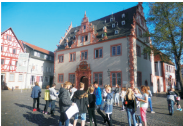
SchülerInnen des MPG auf dem Marktplatz