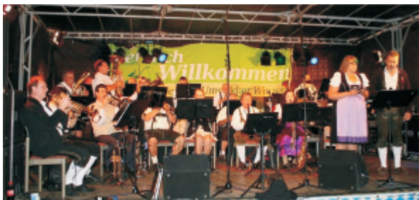
Die Kleestädter FFW-Musikanten auf der Winzerfestbühne

Sie erfreuen ihr Publikum mit einem Repertoire, das von sinfonischer Blasmusik, über Marschmusik, Stimmungs- und Tanzmusik bis hin zu Pop und Rock reicht, also für jeden Anlass genau das Richtige.