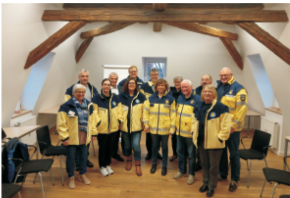
Team der Notfallseelsorge