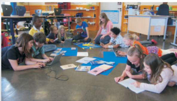
4. Klasse der Grundschule Heubach

Die Kinder der 4. Klasse der Heubacher Schule erkundeten ihren Stadtteil und gestalteten Plakate, die am Tag der Schulen ausgestellt werden.