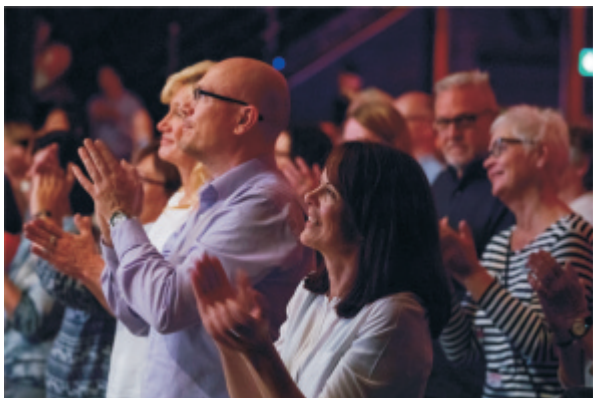
Blick ins singbegeisterte Publikum

Wer das nicht verpassen will, sollte sich anmelden auf www.rudelsingen.de oder direkt zur Abendkasse kommen. Eintritt: 10,- €, erm. 8,- €, Einlass ab 18:30 Uhr