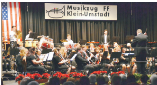
Musikzug der FFW-Klein-Umstadt

Auf dem Marktplatz erwartet Sie zum Ausklang das etwas andere Grillvergnügen: Frank Baumann aus Aschaffenburg präsentiert Ochs am Spieß. Verkauf im Brötchen oder als Tellerportion mit Kartoffelsalat. Im Weinstand Biet schenkt der Weinbauverein Wein aus, die Verschwisterungs-Jugendkomitee zapft frisches Brauhaus-Festbier und die Marktplatzgastonomie und der Stand der Portugiesen vom COP bieten wieder leckere Snacks im Straßenverkauf.