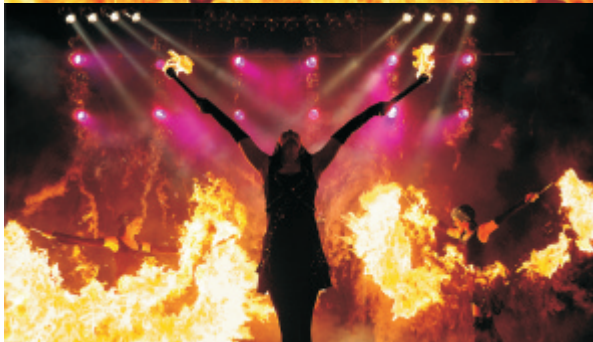
Fire dancer in Aktion