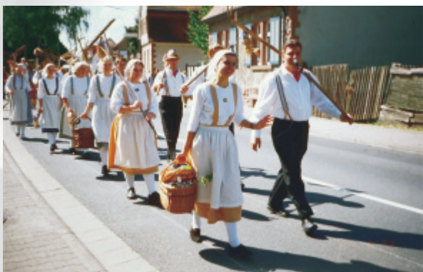
Erntezug des OWK

Spinnen und Weben werden gezeigt und erklärt. Im über 100 Jahre alten Steinofen wird Brot gebacken, und es gibt eine Modenschau alter Handwerkertrachten.