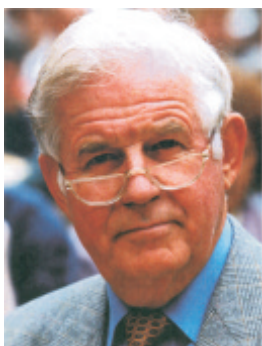
Kurt Biedenkopf

1990 zum ersten Ministerpräsidenten des Freistaates Sachsen gewählt in diesem Amt bis 2002. Seit 2003 ist er als Vorsitzender, seit 2010 Ehrenvorsitzender des Kuratoriums der Hertie School of Governance, außerdem Gründungspräsident und inzwischen Ehrenpräsident der Dresden International University. Im Jahr 2011 übernahm Kurt Biedenkopf eine Forschungsprofessur am Wissenschaftszentrum Berlin für Sozialforschung.