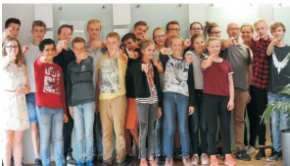
BigBand des Max-Planck-Gymnasiums

Drei Umstädter Bürger werden für die Erforschung, Dokumentation und Veröffentlichung in Schrift und Wort geehrt. Dank Jahrzehnte langen, ehrenamtlichen Engagements, zahlreicher Publikationen, Vorträge und persönlicher Gespräche haben sie der Stadt eine glaubwürdige Haltung zur eigenen Geschichte und einen großartigen Wissensschatz beschert. Der Festabend des Jubiläumsjahres ist willkommener Anlass, ihre umfassende und einmalige Lebensleistung zu würdigen.