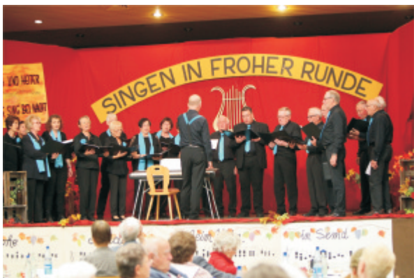
Sängervereinigung Semd – SoCHORage

SoCHORage entstand 2016 anlässlich des 20-jährigen Jubiläum des gemischten Chores, zunächst mit dem Schwerpunkt Celtic Songs . Mittlerweile singt dieser Chor auch andere Chorliteratur, wie z.B. Musik aus dem Mittelalter, von Africa oder Toto, vorwiegend internationale Stücke.