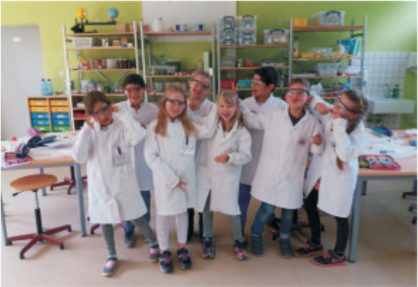
SchülerInnen in der Forscherwerkstatt