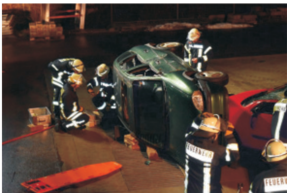
Beispiel einer Schau-Übung