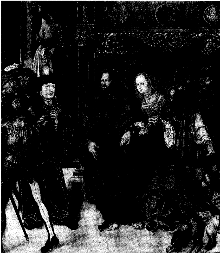
Abb. 6: Cranach-Werkstatt, Christus und die Ehebrecherin, vor 1525?; Öl auf Holz, 112,8 × 97,1 cm; Aschaffenburg, Schloß, Galerie (Bayerische Staatsgemäldesammlungen München: Inv.-Nr. 6246).