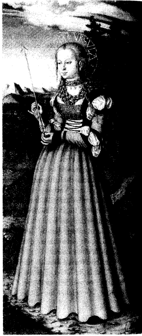
Abb. 3 und 4: Cranach-Werkstatt, Albrecht von Brandenburg als heiliger Erasmus und heilige Ursula, zwei Flügel des sog. Engelaltars; Öl auf Holz, 93,1 × 40,6 bzw. 92,5 × 40,8 cm; Aschaffenburg, Schloß, Galerie (Bayerische Staatsgemäldesammlungen München: Inv.-Nr. 6272 bzw. 6268).