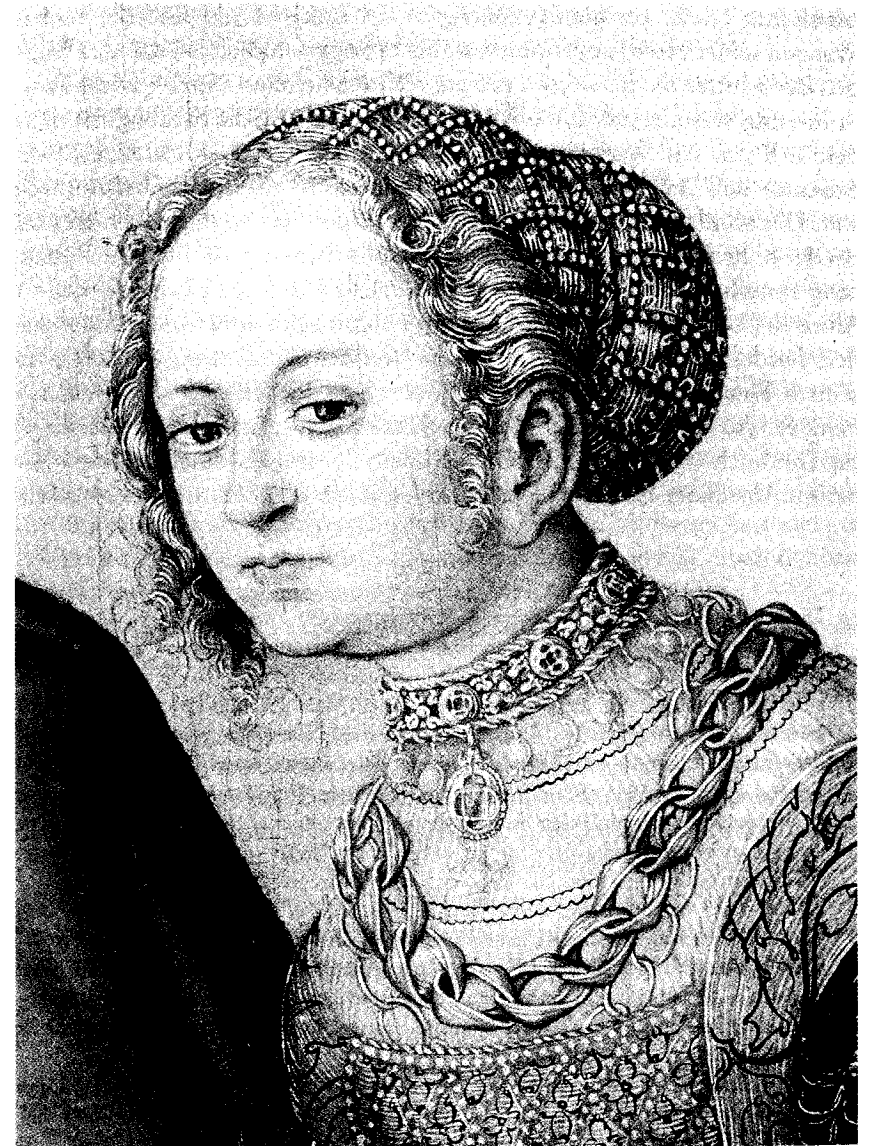
Abb. 7: Cranach-Werkstatt, Christus und die Ehebrecherin, Detail aus Abb. 6.