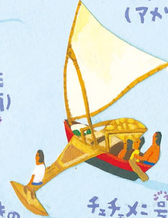
チュチュメニ (ミクロネシア)