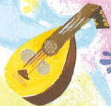
ラクダの 音楽 (ヨルダン)