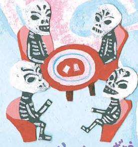
がいじん 骨人形 (メキシコ)