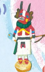
カチナ人形 (アメリカ)