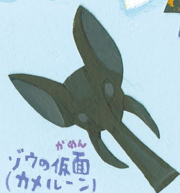
がめん ゾウの仮面 (カメルーン)