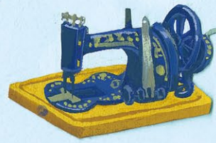
ミシン (アイルランド)