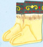
なが 長ぐつ (ロシア)