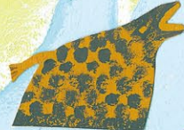
ハイエナの仮面 (ザンビア)