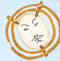
ぎらいようかめん 儀礼用仮面 (アメリカ)