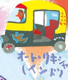
オートリキシャ (インド)