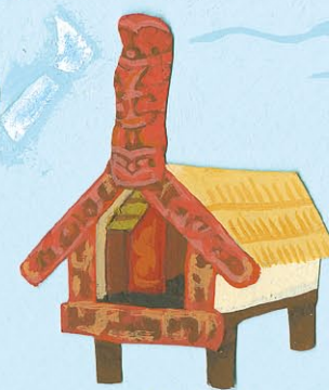
パタカ (ニュージーランド)