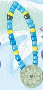
くわい 首かざり (アイヌ)