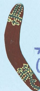
ブーメラン (オーストラリア)