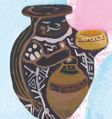
チチャ売り (ペルー)