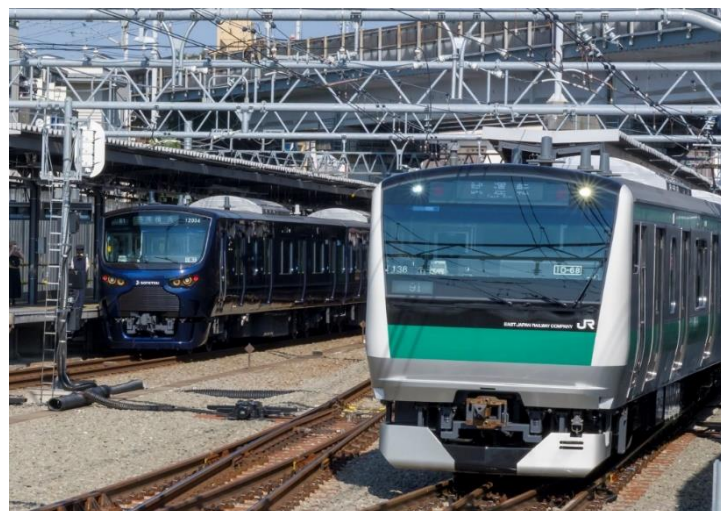
JR線から相鉄線内に乗り入れを行う「E233系」