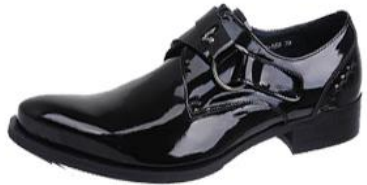
ลักษณะรองเท้าของบัณฑิตชาย ที่ไม่อนุญาตให้ใช้