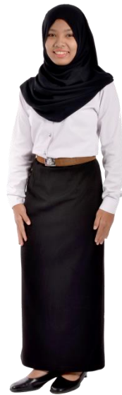
บัณฑิตหญิงมุสลิม