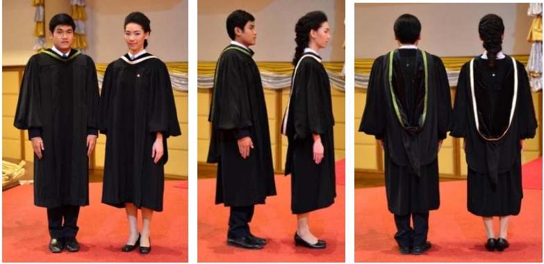
ครูยบัณฑิต