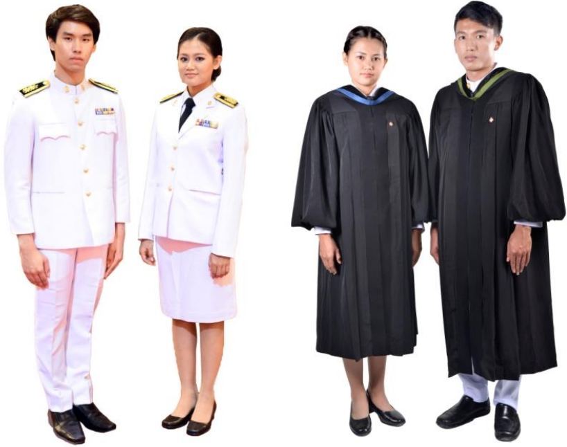
เครื่องแบบปกติขาว