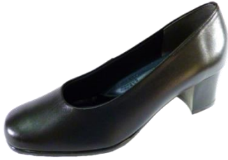
ลักษณะรองเท้าของบัณฑิตหญิง ที่อนุญาตให้ใช้