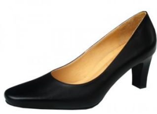
ลักษณะรองเท้าของบัณฑิตหญิง ที่ไม่อนุญาตให้ใช้