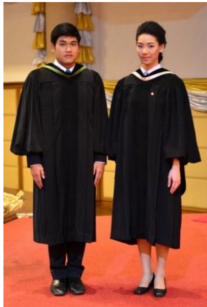
ครุยบัณฑิต