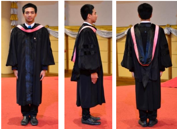
ครูยมหาบัณฑิต