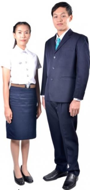
เครื่องแต่งกายบัณฑิต