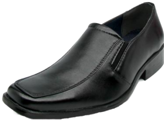
ลักษณะรองเท้าของบัณฑิตชาย ที่อนุญาตให้ใช้