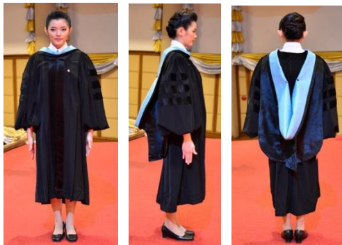
ครูยดุขฎีบัณฑิต