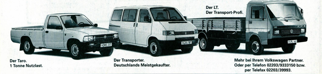
Der Taro. 1 Tonne Nutzlast.