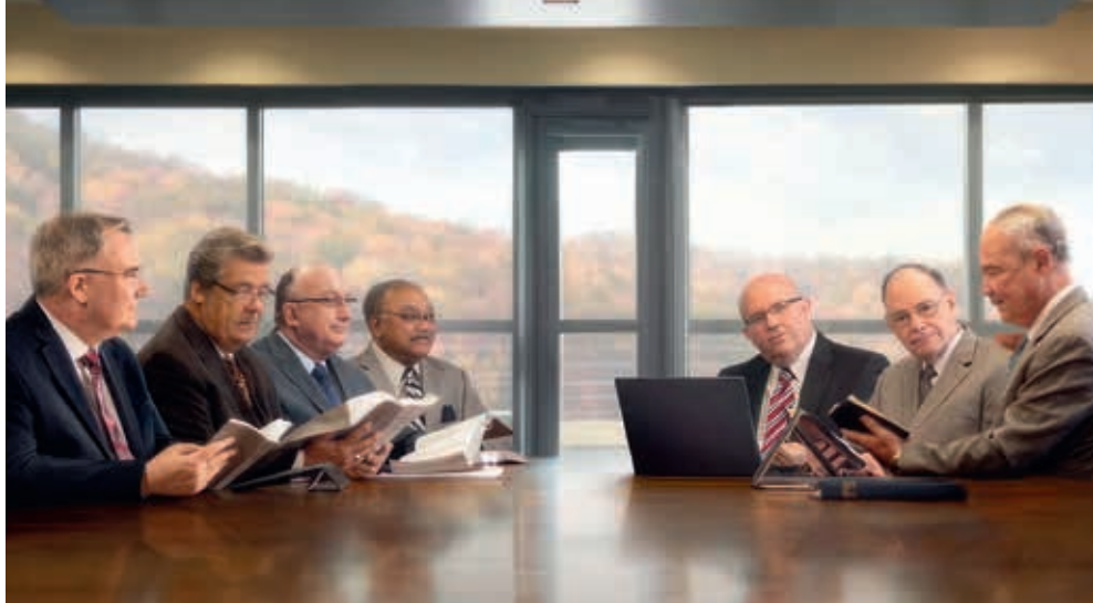
Руководящий совет Свидетелей Иеговы. В 2023 году состоит из 9 человек

фортные, но скромные. Они живут и трудятся на виду у других Свидетелей Иеговы, которые работают во Всемирном главном управлении Свидетелей Иеговы, — проектируют богослужебные здания, координируют деятельность собраний и делают многое другое. Уверен, что любой человек, которому довелось познакомиться с кем-то из членов Руководящего совета может засвидетельствовать их скромность и чувство ответственности перед Богом, которое в Библии называется «страх Божий» (Второе послание к Коринфянам 7:1). Помазанники, которые служат в Руководящем совете, очень ценят Библию, у них большой опыт в житейских и духовных вопросах. Каждую неделю они собираются, чтобы обсудить потребности Международной Организации Свидетелей Иеговы. Руководящий совет отвечает за подготовку духовной пищи и назначение ответственных братьев, а также содействует продвижению дела проповеди о Царстве. В подражание апостолам члены Руководящего совета дают основанное на Библии пастырское руководство в письмах, а также через других служителей. Благодаря современным технологиям у Свидетелей Иеговы есть собственный телевизионный канал в сети Интернет. Руководящий совет регулярно выпускает видео со своими обращениями по самым животрепещущим вопросам, а также с речами и проповедями на различные библейские темы. Свидетели Иеговы разных стран видят своих пастырей на экранах компьютеров,