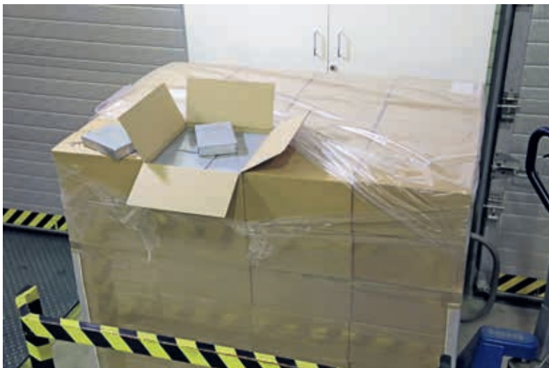
Выборгская таможня изъяла партию из 2000 экземпляров Библии