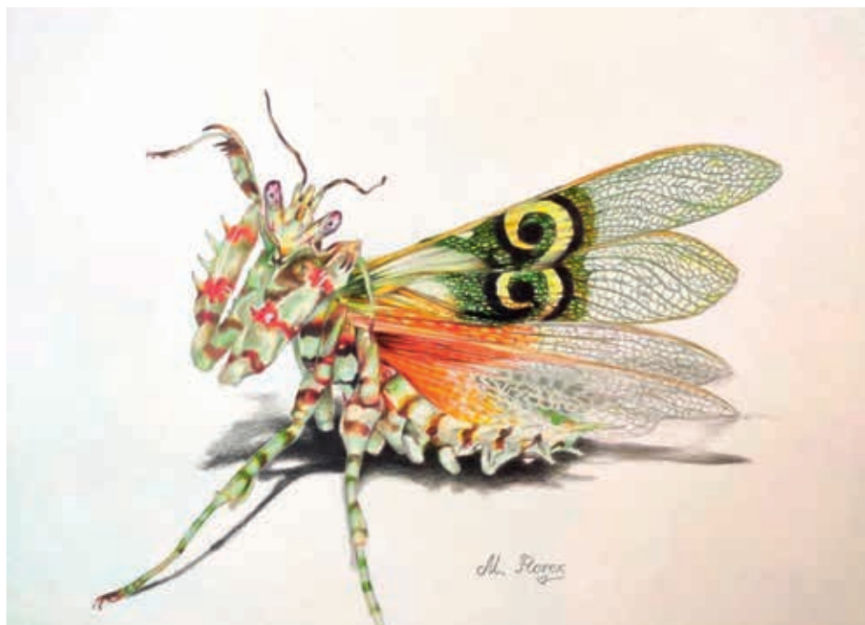
Рисунок Нины Коробейниковой