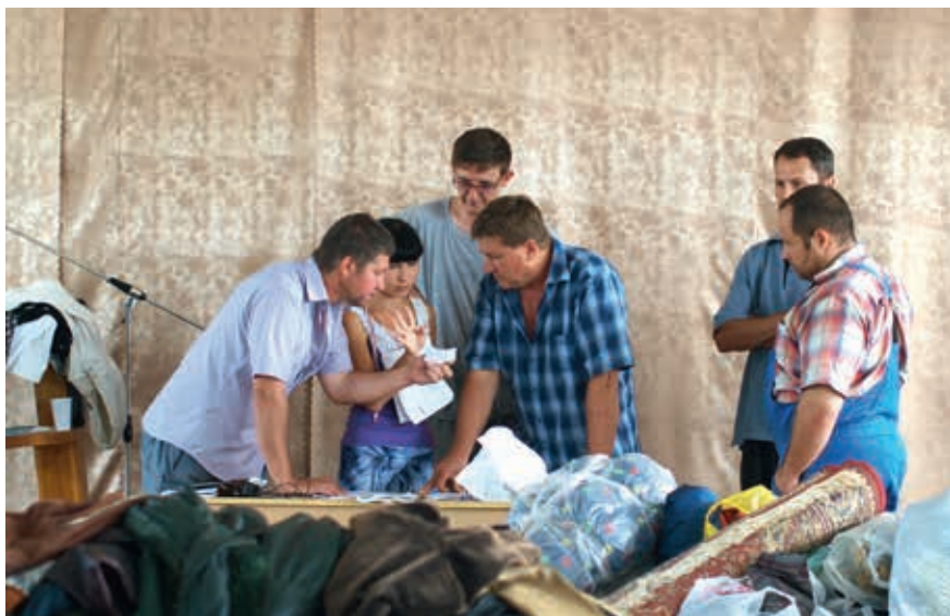
Помощь пострадавшим от наводнения в Крымске в 2012 году