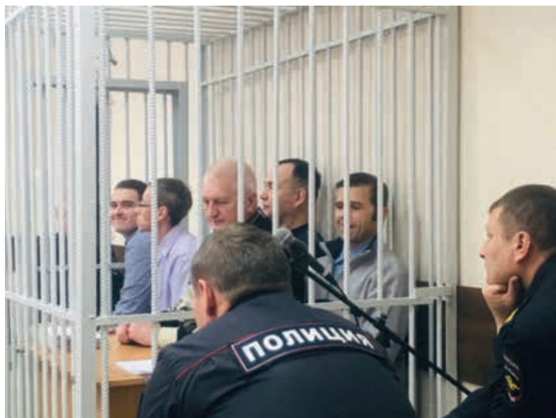
В июне 2022 года были осуждены условно на сроки от 2,5 до 6,5 лет

«Учитывая положение вашей жены, мы можем завтра отпустить вас домой». Но я ему сразу сказал, что своих друзей я никогда не предавал и не буду предавать. И Иегову никогда не предаю. Он бумагу убрал: «Уведите!»