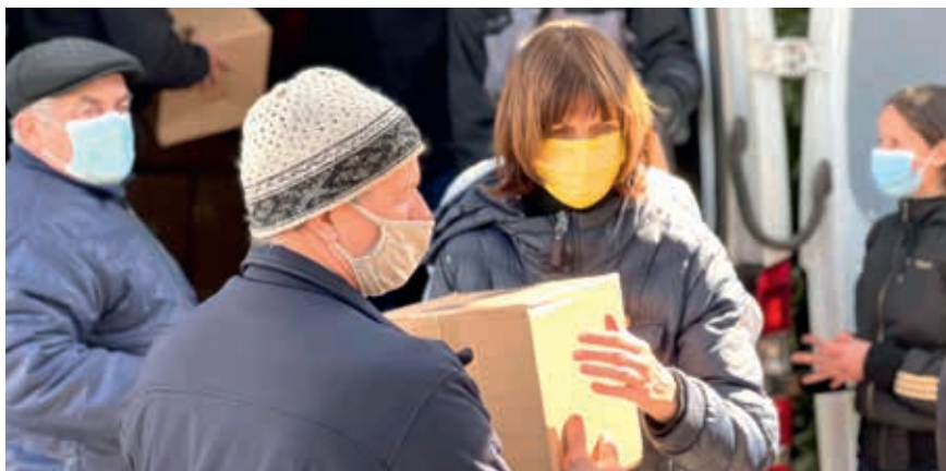
В Украине организована помощь единоверцам и их семьям (2022)