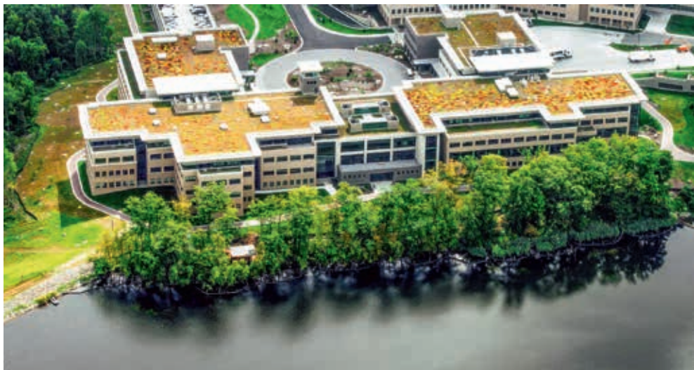
Комплекс главного управления Свидетелей Иеговы в штате Нью-Йорк (США) удостоился наивысшей оценки за экодизайн

выпуска и числу языков, на которых издаётся журнал «Сторожевая башня», он является одним из наиболее широко распространяемых журналов в мире.