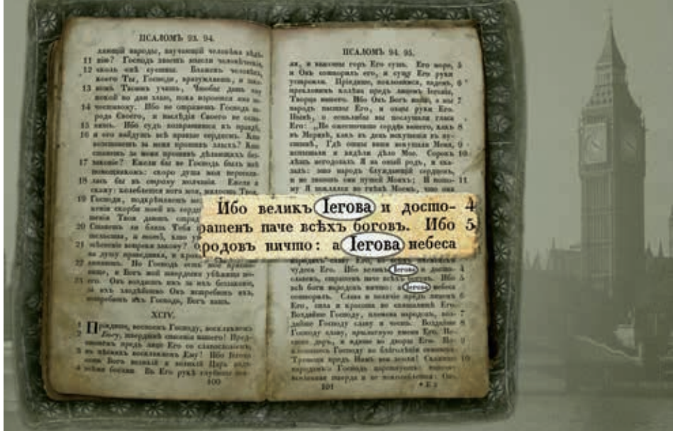
Имя Бога в Псалтири (перевод Г. П. Павского, 1822)

католического богослужения были песни «Я благословлю Яхве» и «Восстань, о Яхве». 29 июня 2008 года Папская Конгрегация богослужения и дисциплины таинств 14 направила епископским конференциям официальную инструкцию, предписывающую прекратить произнесение имени Бога «Иегова» или «Яхве» в песнопениях и молитвах во время католических богослужений 15 . Свидетели Иеговы убеждены, что в Библии — книге, написание которой вдохновил Бог, — по воле самого Всевышнего около 7 тысяч раз появляется его личное имя Иегова. Также Бог повелел своим служителям произносить его имя (Книга пророка Исаии 42:8; Книга пророка Иоили 2:32; Книга пророка Малахии 3:16; Послание к Римлянам 10:13). Кроме того, Бог осудил ложных пророков, которые пытались заставить народ забыть его имя (Книга пророка Иеремии 23:27).