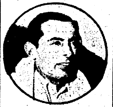
● FAUSTO COPPI