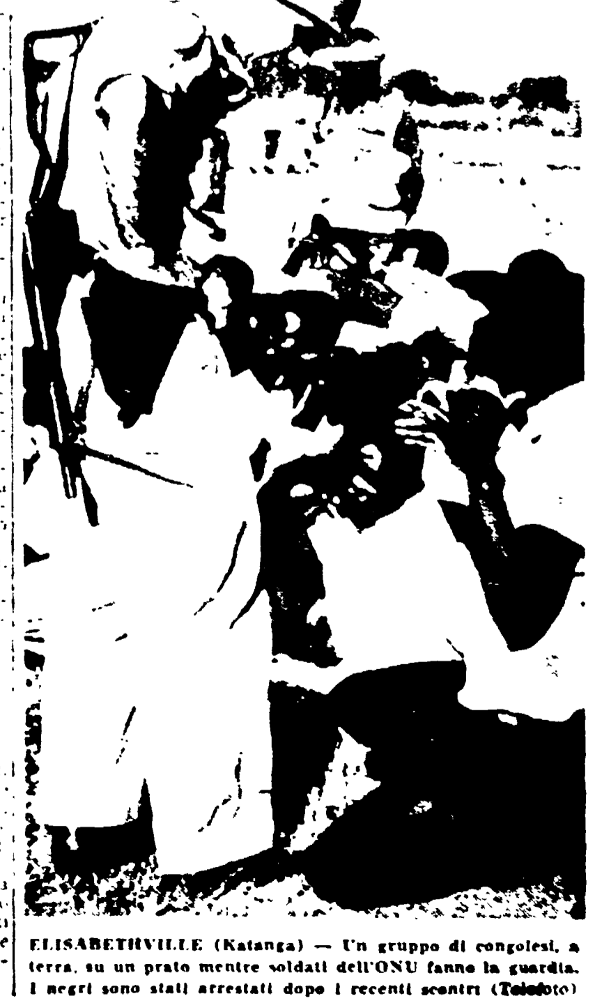
ELISABETHVILLE (Katanga) - Un gruppo di congolese, a terra, su un prato mentre soldati dell'ONU fanno la guardia. I negri sono stati arrestati dopo i recenti scontri