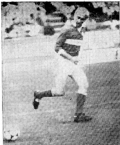
Игорь Нетто — капитан сборной ветеранов СССР

В нашей футбольной истории есть Имена, над которыми не властно время. И дело тут даже не в титулах, не в количестве завоеванных медалей и различных призов. В конечном счете цифры эти постепенно стираются в памяти, сами мастера тоже относятся к ним, как правило, весьма спокойно. Не реестр наград и голов определяют свежесть оставленного мастером следа. Определяет игра, которую он показывал. Тот коллективный портрет футбола, который он рисовал вместе с остальными десятью партнерами.