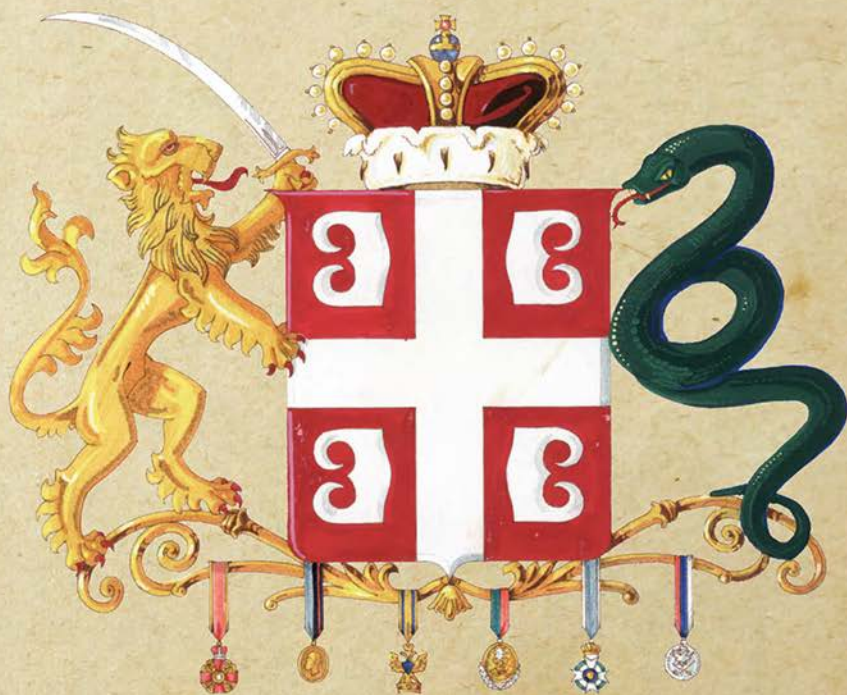
Грб Милоша Обреновића, рад Драгомира Ацовића, ИАБ, Легат Драгомира Ацовића