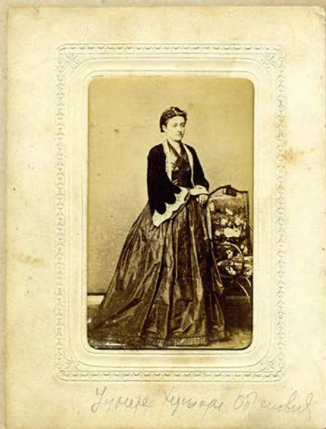
Кнегиња Јулија Хујади Обреновић