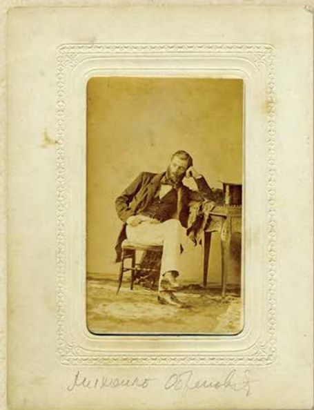
Кнез Михаило Обреновић