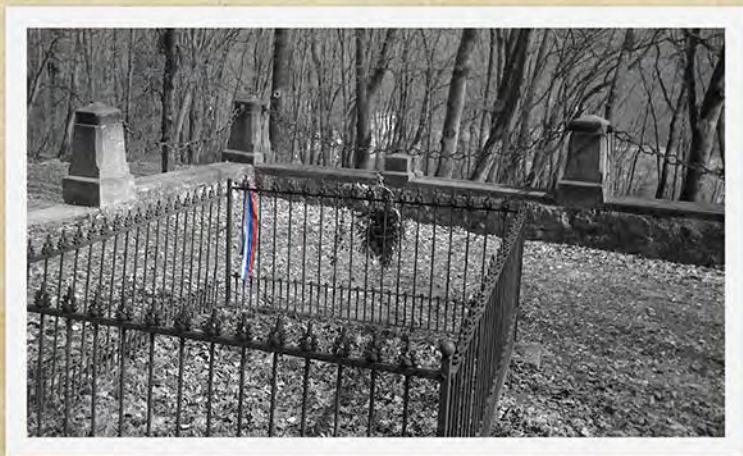
Кошутњак, место убиства кнеза Михаила Обреновића, приватна збирка