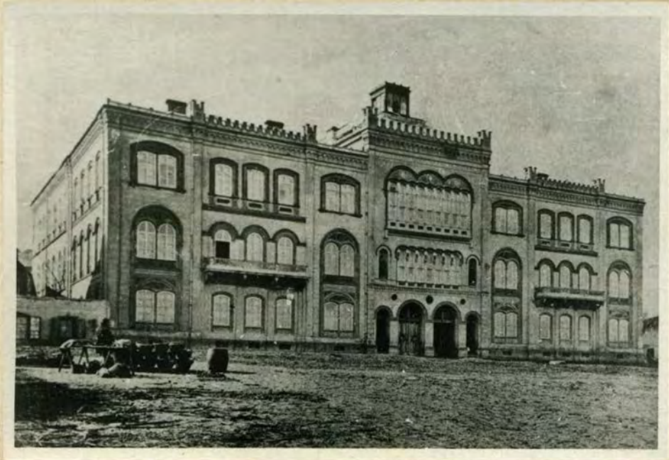
Капетан Мишино здање, ИАБ, ЗФ