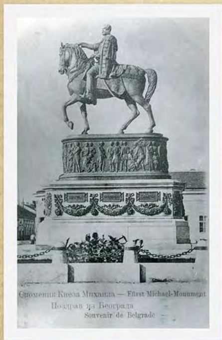
Споменик кнезу Михаилу Обреновићу

Споменик кнезу Михаилу, дело италијанског вајара Енрика Пација, подигнут је 1882. године на Позоришном тргу, данашњем Тргу републике. Свечано откривање споменика уприличено је поводом проглашења Краљевине Србије. Посвећен је трагично настрадалом кнезу али и ослобођењу Србије од турске власти. Подигнута кнежева рука уперена је ка Босни, још неослобођеној српској области. Главна и једна од најлепших улица престонице данас носи име кнеза Михаила у знак сећања на великог владара.