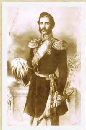
Кнез Михаило Обреновић

Михаило Обреновић рођен је септембра 1823. године у Крагујевцу, као други син кнеза Милоша и кнегиње Љубице. По Милошевој абдикацији и након смрти прворођеног брата Милана, Михаило је из Влашке, преко Цариграда, стигао у Србију како би наследио кнежевско достојанство. До доласка у земљу власт је преузело Прво намесништво (1839–1840) које су чинили Аврам Петронијевић, Јеврем Обреновић и Тома Вучић Перишић.