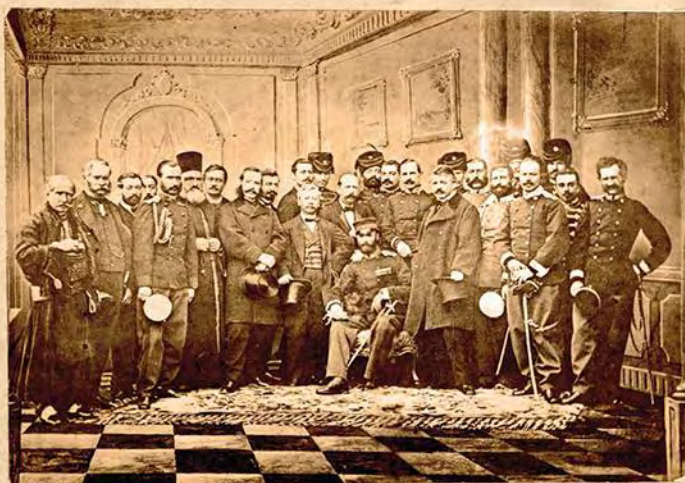
Кнез Михаило са својом свитом у Цариграду