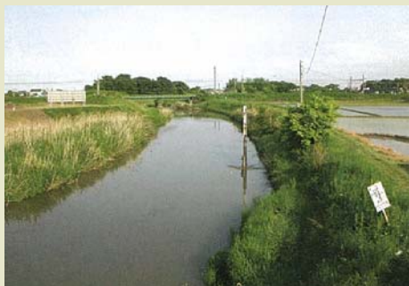
綾瀬川(埼玉県・東京都)

綾瀬川清流ルネッサンスII地域協議会では、水質調査、クリーン作戦、各家庭での取り組み、水環境モニター制度、浄化装置の設置など、水環境の再生をめざし活動しています。