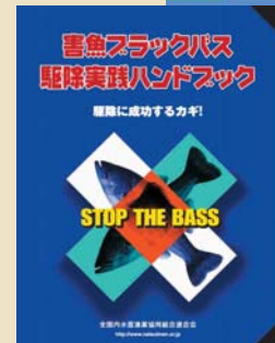
外来魚対策マニュアル