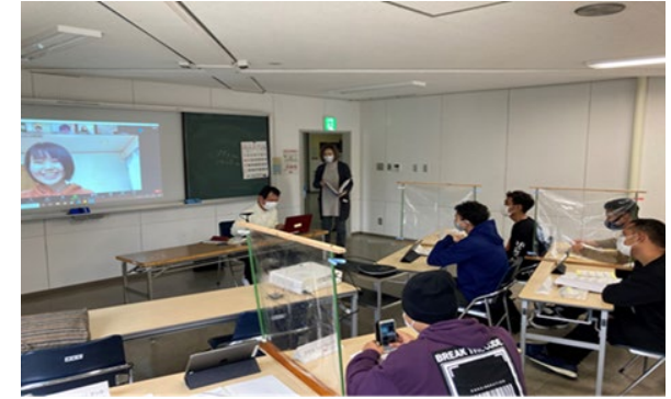
▲オンラインで発表する学習者 (画面に映っているのは指導役の大学生)

■ 中山間地域の浜松市天竜区は、外国人散在地域で、日本語の指導ボランティアの高齢化が進む中、指導役の確保が課題。