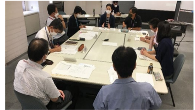
▲多文化共生に関する市町連絡協議会で日本語教室の先行設置市町の事例を紹介

■外国人・日本人のコミュニケーションが円滑に図れる環境づくりを整備し、多文化共生の地域づくりを推進するため、全市町に日本語教室を設置することを目指した。