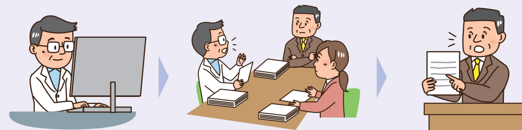
①事前に決定した手順に従い、論文を選別

事業者の都合で機能性があることを示す論文だけを意図的に抽出することはできません。