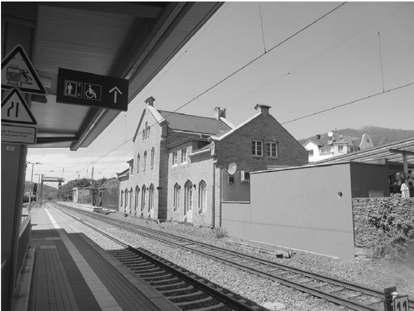
Bahnhof Plettenberg, 14. Juli 2022.

Ich beabsichtige, nach unserem Treffen persönlich Plettenberg zu besuchen. War dort der Katholizismus so maßgebend?