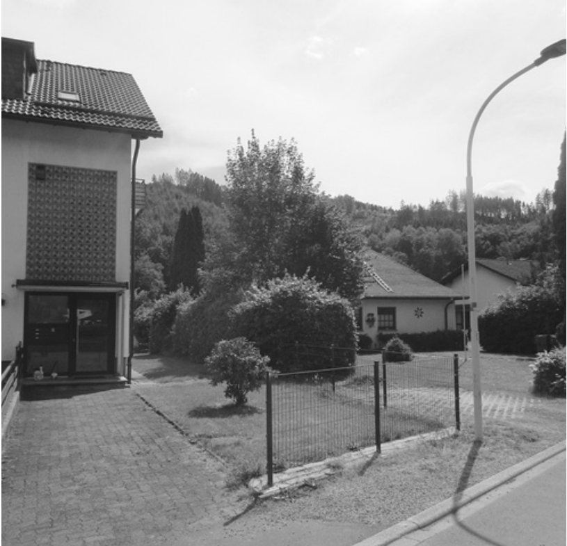
Plettenberg-Pasel, 14. Juli 2022.

Hüter der bundesdeutschen Verfassung geworden ist und die Vergangenheit der katholischen Kirche im Krieg kritisiert hat. Warum besaß Carl Schmitt nach dem Krieg so eine erhebliche Anziehungskraft auch für ausdrückliche