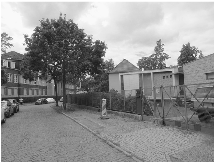
Kaiserswerther Straße in Berlin-Dahlem, 9. Juli 2022.

Carl Schmitt hat sich bei seinen Sprachstudien öfter mit Luthers Bibelübersetzung befasst. Luther habe die Heilige Schrift verdeutscht, er habe sie der deutschen Sprache einverleibt. Damit ist die Luthersche Sprache zur eigentlichen Sprache der Deutschen geworden, in wesentlichen Worten sei sie eine heilige Sprache.