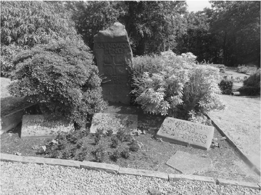
Grabmal Schmitts auf dem katholischen Friedhof Plettenberg, 14. Juli 2022.

wie Koselleck, Böckenförde usw. waren da. Das war eine kleine Universität. Ich war vier Mal da. Das war sehr anregend und schön 11 .