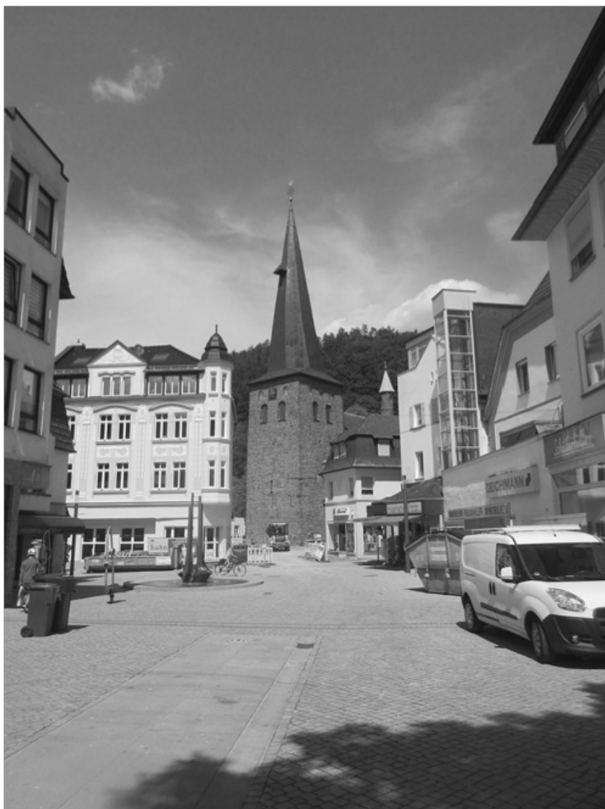
Evangelische Kirche im Stadtzentrum Plettenberg