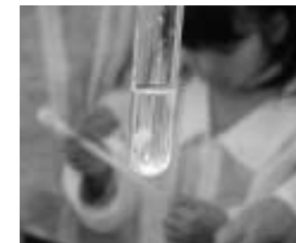
バイオコース 「組換えDNA実験指針」を踏まえ、遺伝子工学の基礎実験が学べるプログラムを開発、導入していく予定です。

中学や高校などで遺伝子組換え実験を認めることなどを盛り込んだ「組換えDNA実験指針」がまとまり、高校以下でも遺伝子組換えを体験することが可能になります。これは「組換えDNA実験を行いたい」との要望が理科の先生方から出ていることを受け、中学、高校など理科施設を設けている教育施設で安全に実験できるように「教育目的」の内容を盛り込んだ実験指針となっています。実験中は教室の窓や扉を閉めるなどの条件がついており、校長の同意で実施できるようになります。例えば、教育目的で取り扱いが可能な遺伝子は11種類に限定し、クラゲ由来の「光る」遺伝子を大腸菌に組み込んで光らせたりするなど、わかりやすい実験ができるようになります。しかしながら、このような遺伝子組換えの技術を教育の現場で実施するのは、なかなか敷居が高いことだと思われます。未来館では中学、高校などの教育施設に先駆けて、遺伝子工学の基礎実験が学べ、先端技術が身近に感じられるようなオリジナルプログラムを開発、導入の予定です。