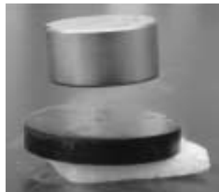
超伝導コース 高温超伝導体を使う実験をメインに磁場の中でのイオンの不思議な回転や磁気浮上リアモーターカーの原理などについて理解を深めることができます。

4つの効果があり応用が期待されていますが、いずれも本質を理解するには量子力学的知識が必要です。実験工房のコースでは、原理を理解することよりも超伝導を中心にその周辺にある電磁気さまざまな現象について興味を持ってもらうことを目標としています。本コースのプログラムの一つ「超伝導と磁場のミステリー」では主として前記について体験して頂けます。