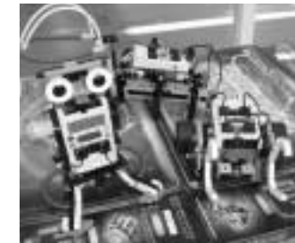
ロボット感覚系コース 赤や緑の色や明るさがロボットにはどんな風に見えるのか、ロボットが見ている世界はどんな感じなのかを調べることで、センサの役割について理解を深めることができます。

ます。センサ群を中心に環境情報の取得手段をいろいろな角度から検討し、あらかじめ指定した行動をするように環境情報を操作することを通じて、体験的に「環境に応じて制御されるロボット」のしくみについて学んでいきます。