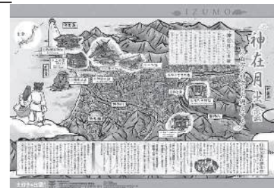
神在月出雲マップ

市ではこの時期(10、11月)を「神在月文化振興月間」とし、市民挙げて、文化、スポーツ等の様々な分野の盛り上げを図っています。全国に知られるこの出雲のお話を簡単にまとめ、私たちから来訪者等にお話できる“おもてなし”にしたいと考え、マップを作成しました。