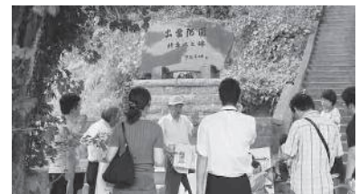
取材のようす (奉納山入口)

現在作成中の『街歩きマップ』は、地域の協力を得た出雲大社周辺の取材結果をベースに、地元の魅力がいっぱい詰まったガイドブックに仕上げたいと考えています。