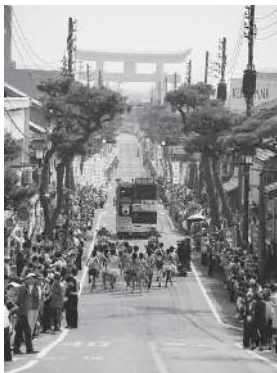
前回の出雲駅伝の様相▲▶