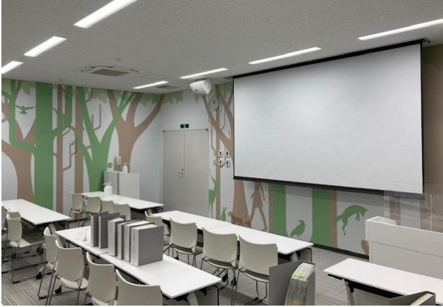
大会議室 (社会科見学等の団体見学で使います)

新施設では「ビューティフルIZUMO」をテーマに、私たちの暮らす美しい町や自然を守るために、ごみ処理を通じて、私たち自身に“何が”できるのかを感じていただけるように展示をしています。