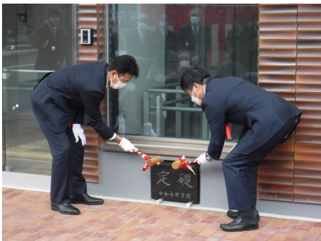
定礎式 (左：飯塚市長、右：萬代市議会議員長)