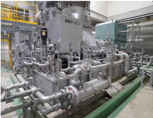
蒸気タービン発電機

（ごみの匂いが外に漏れないよう、エアカーテン、高速電動シャッターを採用しています）