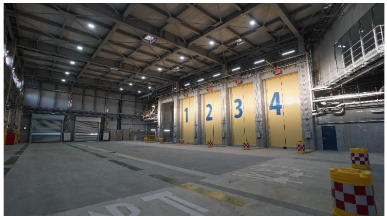
プラットフォーム

（ごみの匂いが外に漏れないよう、エアカーテン、高速電動シャッターを採用しています）