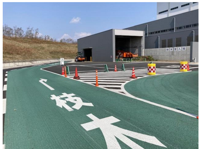
剪定枝ストックヤード