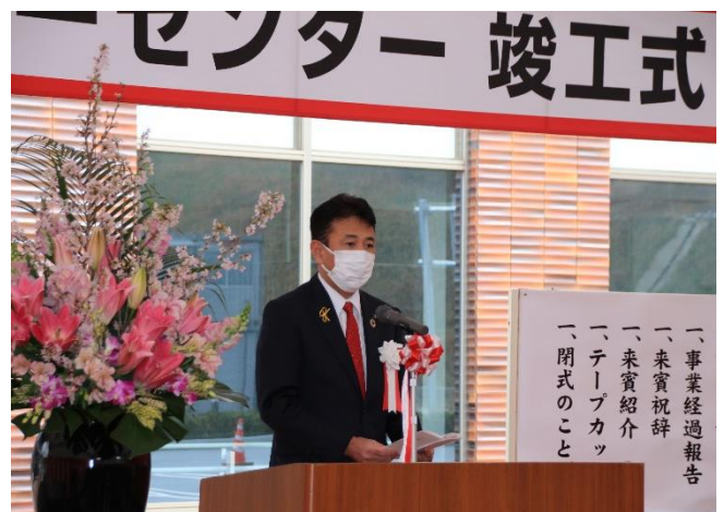
飯塚市長あいさつ